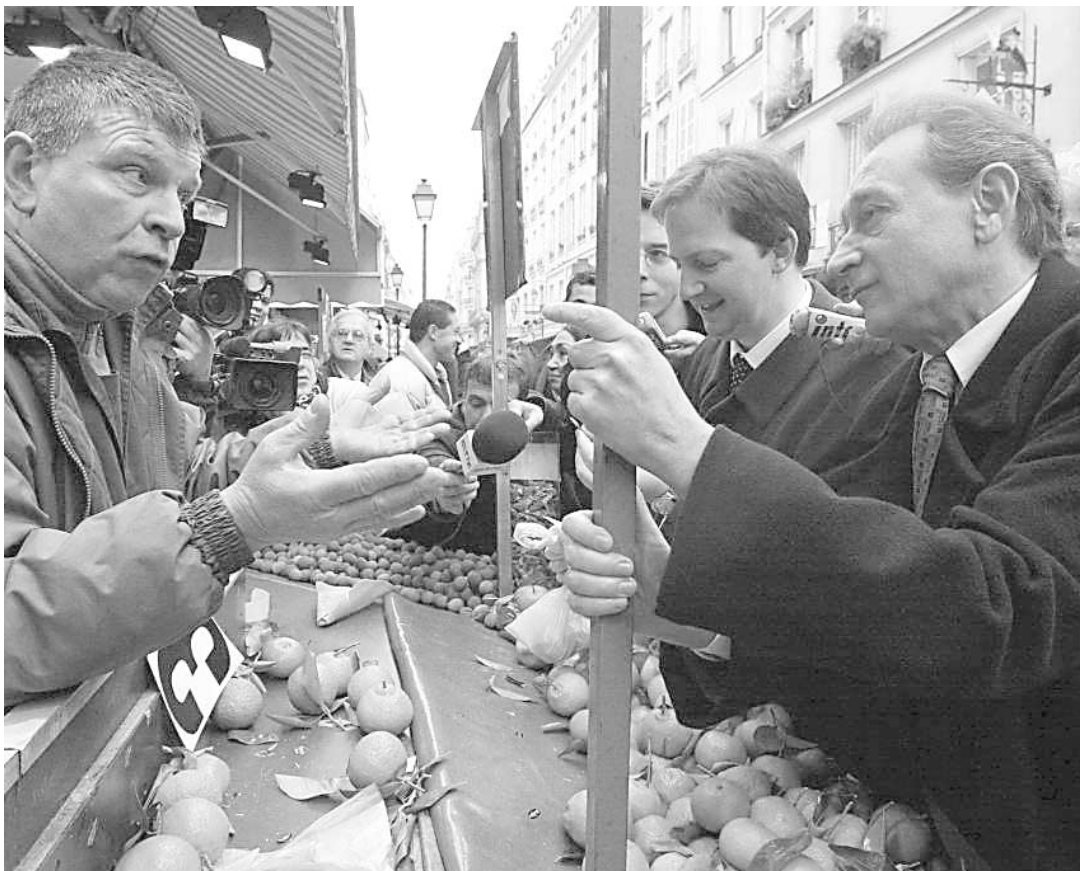
Le maire de Paris, Bertrand Delanoë (à droite), discute avec un vendeur de fruits et de légumes dans la rue commerciale Montorgueil, au centre de Paris, lors d'une tournée qu'il effectuait récemment avec des homologues d'autres capitales européennes.

En Italie, « les hausses sont bien là et de