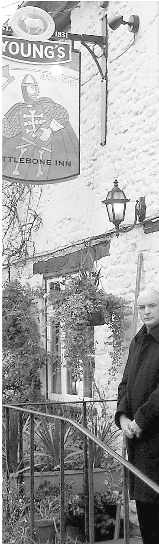
Une sentinelle non identifiée monte la garde devant le Rattlebone Inn, à Sherston, pub d'où le prince Harry aurait été expulsé après avoir semé la pagaille.