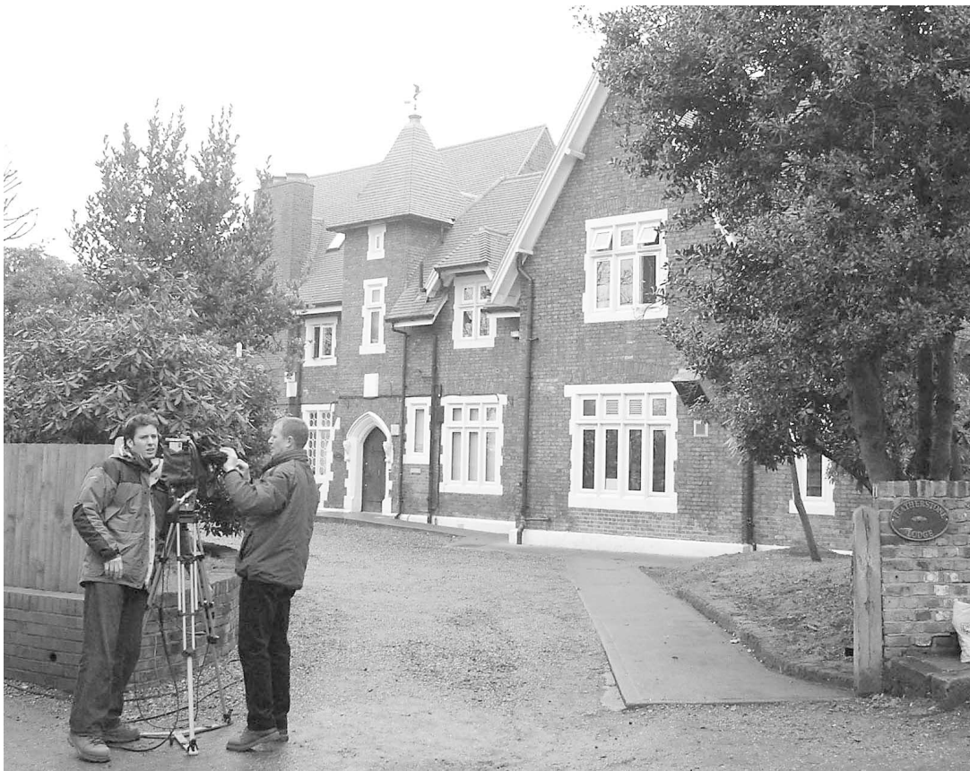
Le prince Charles a décidé d'envoyer son fils visiter le centre de désintoxication Featherstone Lodge, dans le sud de Londres (ci-dessus).

Selon le Sunday Times , l'adolescent introverti et scolairement en retard devient un jeune homme de plus en plus sûr de lui, amateur de sport (le ski, la chasse), et prêt à prendre des risques physiques jusqu'à être un peu casse-cou. Harry n'a en tout cas pas une place facile dans la famille déjà compliquée des Windsor. La révélation de ses excès va le mettre un peu plus encore en porte-à-faux avec l'image parfaite de son grand frère William, 19 ans, le favori des Britanniques en général et des jeunes filles en particulier, solide gaillard au sourire irrésistible, et réputé, lui, être résolument antidrogue.