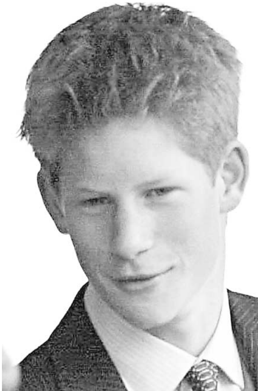
Le prince Harry

« Contrairement aux habitudes prises depuis la mort de la princesse Diana en 1997 », relevait le tabloïd, le jeune prince avait été laissé seul, son père étant pris par ses occupations à Londres et le prince William en