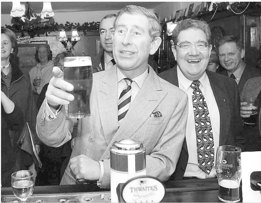
Photo d'archives du 17 décembre dernier alors que le prince Charles déguste un verre de bière au cours d'une visite de l'hôtel Craven Heifer à Stainforth, près de Settle. Boire avant l'âge de 18 ans constitue une infraction en Grande-Bretagne. Harry a aussi fumé du cannabis.