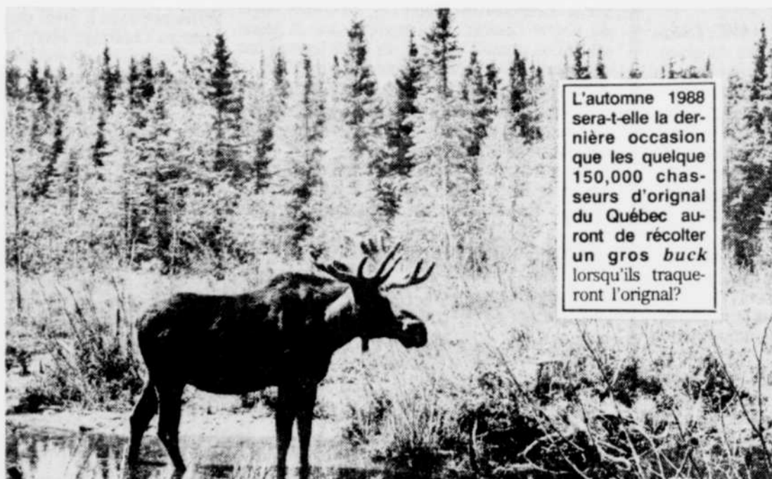
L'automne 1988 sera-t-elle la dernière occasion que les quelque 150,000 chasseurs d'original du Québec auront de récolter un gros buck lorsqu'ils traqueront l'original?

Pourquoi vouloir tout bouleverser, encore une fois? Les scientifiques du gouvernement