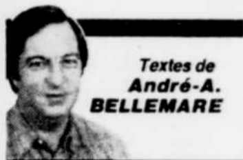
Textes de André-A. BELLEMARE

◆ Bon nombre des quelque 150,000 chasseurs d'original du Québec auront une très désagréable surprise, au cours des prochaines semaines, lorsqu'ils prendront connaissance du contenu du tout nouveau résumé des règlements sur la chasse et le piégeage pour 1988-1989. En effet, durant l'automne prochain, il faudra « annuler » trois permis de chasse par original abattu dans plusieurs ZEC, même quatre permis!