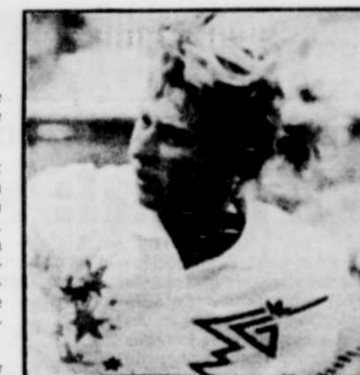
Les amateurs de tennis de Montréal devront se passer de la joueuse de tennis n° 1 au monde, Steffi Graf.