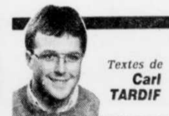
Textes de Carl TARDIF