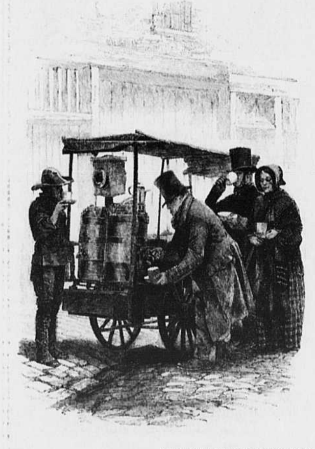
ILLUSTRATION: THE COFFEE BOOK

Chez Net-Net, les buandiers ont un code de déontologie qui leur interdit certaines indiscretions.