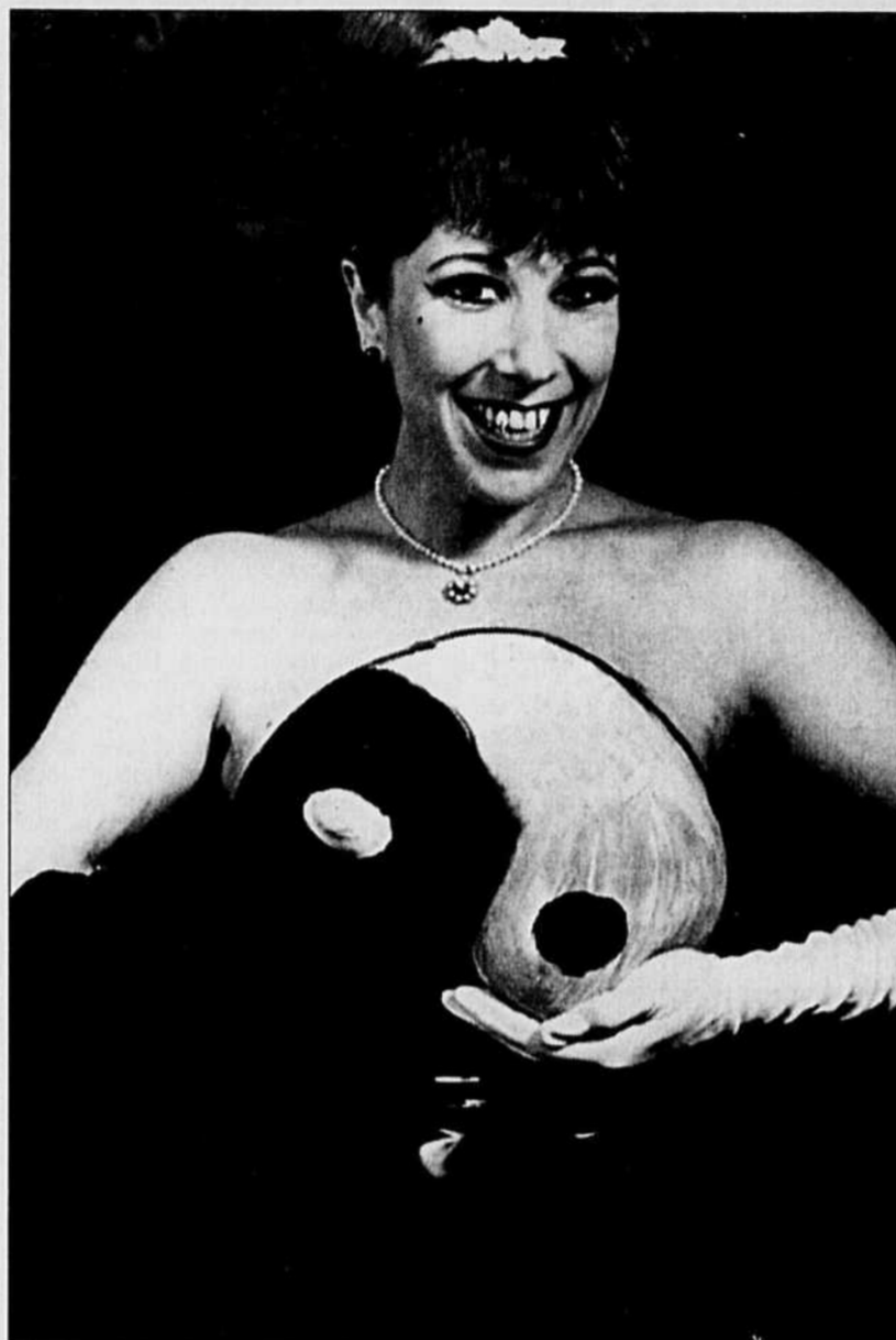
Le yin et le yang à la façon Annie Sprinkle.