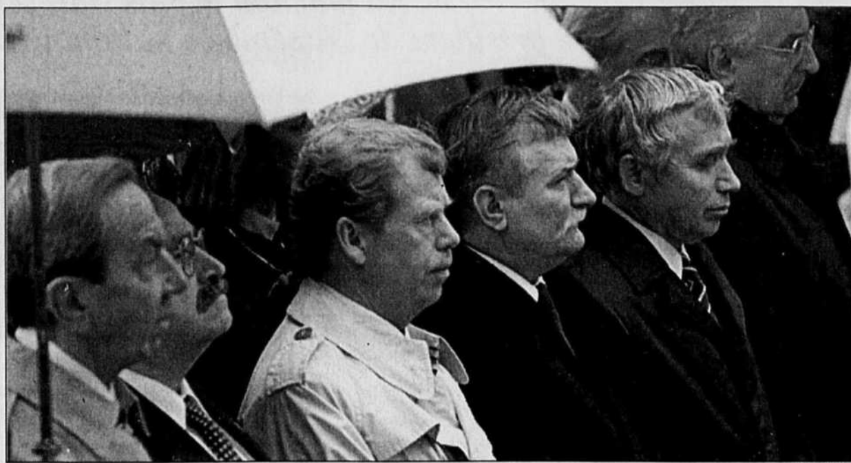
L'Europe de l'Est officielle «sous le parapluie» américain: Warren Christopher avec l'Albanais Aleksandr Meksi, le Tchèque Vaclav Havel, le Polonais Lech Walesa, le Bulgare Zhelev et le Croate Franjo Tudjman.

L'auteur enseigne les sciences politiques à l'Université du Québec à Montréal.