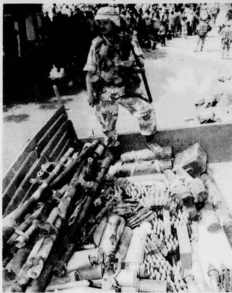
Un Marine américain surveille un camion d'armes saisi au marché Bakara de Mogadiscio, en Somalie, dans une opération impliquant 900 soldats. On y trouve de tout, depuis les armes de poing jusqu'aux roquettes anti-chars, en passant par les carabines M-16.

Dans les milieux diplomatiques, on doute que cet accord soit un jour appliqué, les chefs de clans réunis à Addis-Abeba ayant peu d'emprise sur leurs troupes, qui poursuivent leurs actions armées dans plusieurs régions de Somalie.