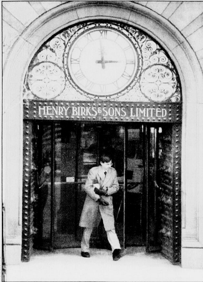
Un client quitte la bijouterie centenaire Henry Birks and Sons, à Montreal. La compagnie s'est placée sous la protection de la Loi sur la faillite et l'insolvabilité.

magasins portant le nom de Birks et 70 autres, appartenant à la compagnie mais portant d'autres noms.