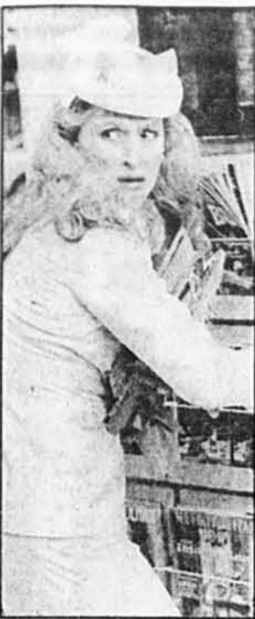
Meryl Streep dans She-Devil