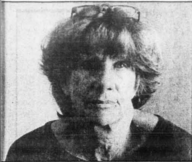
Narcisa Hirsch