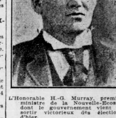
L'honorable H.G. Murray, premier ministre de la Nouvelle-Écosse, dont le gouvernement vient de sortir victorieux des élections d'hier.