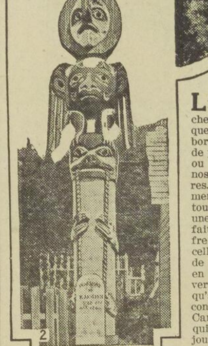
1.—L'hôtel de Banff, dans les Rocheuses. 2.—Totem indien sur la Côte de l'Alaska. 3.—Vapeur du C. P. R. devant le glacier Taklu, Alaska.

du Pacifique, exerce un attrait exceptionnel chez les nôtres.