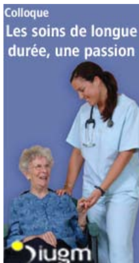
Colloque "Les soins de

Forum citoyen mauricien Les 23, 24 et 25 octobre prochain.