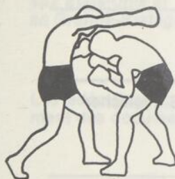
esquive sur un direct du droit