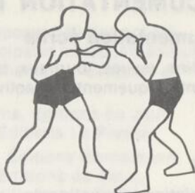
crochet du droit à la face