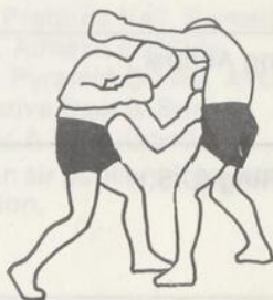
esquive d'un direct du gauche et uppercut du gauche au foie