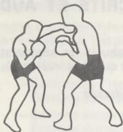
swing du gauche à la face