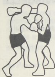
uppercut du droit au menton