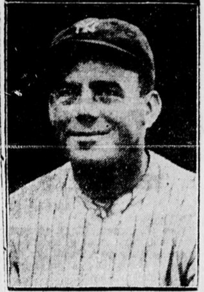
BENNY BENGOUGH, receveur des Yankees, reprend le bâton avec confiance de traverser une saison heureuse.

Une seule joute avait lieu hier soir dans la ligue majeure de balle aux bases de l'université, elle mettait aux prises deux équipes qui se sont rencontrées plus d'une fois, depuis l'ouverture de la saison, pour décider de leur supériorité. Les sœurs Moran et Labrosse ne sont plus amis lorsqu'ils se rencontrent dans des tournois athlétiques: ils se connaissent et c'est tout.