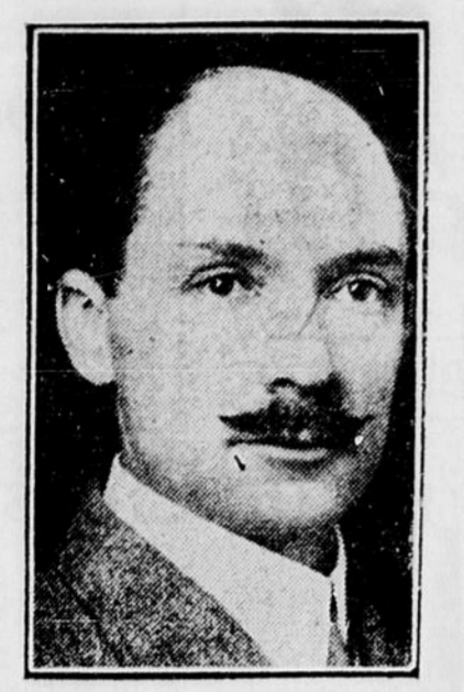
L'honorable sénateur A.-C. HARDY, choisi président du sénat canadien hier, en remplacement de feu le sénateur Hewitt Bostock.

Aujourd'hui les temps sont bien changés. Autrefois des incidents sans signification provoquaient des guerres, et la chute du haut d'une tenière, de ceux plénipotentiaires, et la guerre d'Espagne à des oreilles coupées. Les nations sont devenues sensibles dans leurs principes, suivant les exigences du plus grand bien-être du plus grand nombre.