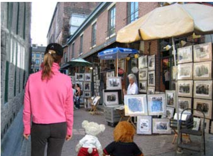
Mademoiselle X et les deux mascottes,