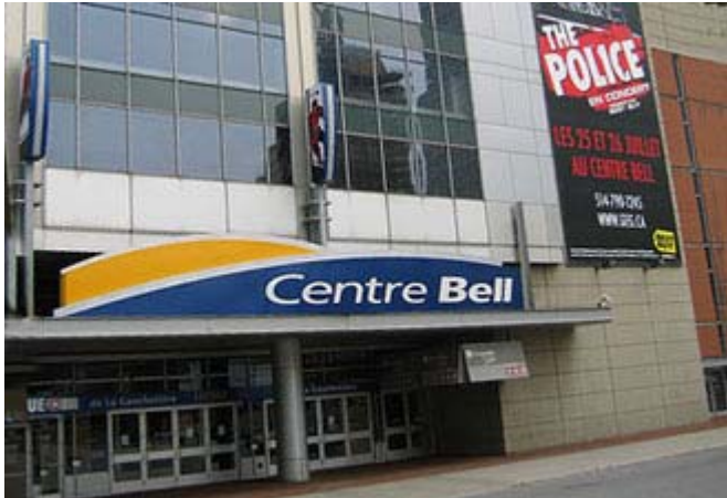
Centre Bell - Montréal

Un conflit a éclaté sur la place publique à Montréal entre le Groupe Gillett (Centre Bell) et le journal Le Devoir . Le débat se déroule autour de l'accès des journalistes du journal quotidien aux spectacles présentés au complexe appartenant au propriétaire du club de hockey Les Canadiens. Le groupe Gillett ne veut accorder que 10 billets médias par spectacle et on dit ne pas en avoir pour le Devoir, un média du qualibre du journal Le Monde à Paris. LeStudio1.com appuie Le Devoir et nous appliquons nous aussi la politique reconnue partout dans le monde: "Pas d'invitation - Pas de couverture" www.LeStudio1.com/LeDevoir