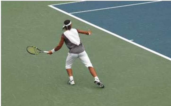
Rafael Nadal - Montréal 2005

Les 45 meilleurs joueurs de tennis du monde seront à Montréal pour le tournoi de la Coupe Rogers , édition 2007, qui se déroulera du 4 au 12 août prochain au Stade UniPrix. Ce tournoi annuel attire les foules évidemment grâce à la présence des vedettes