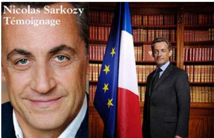
Nicolas Sarkozy et son livre