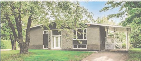
NOUVEAU SUR LE MARCHÉ | 799 000 $