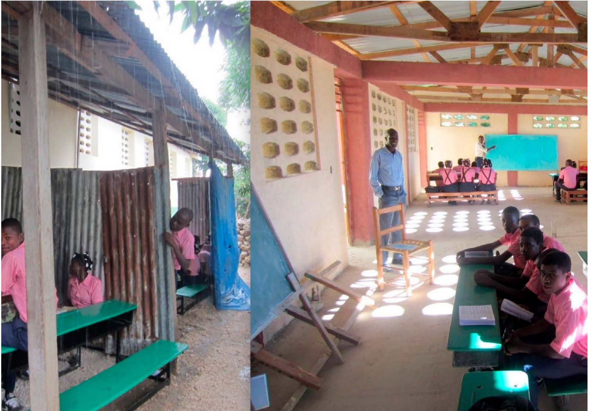
Minta attend vos projets, notamment en éducation.

Minta Saint-Bruno lance sa traditionnelle invitation aux Montarillois et aux Grandbasilois souhaitant s'investir dans un projet humanitaire à réaliser en 2023 dans un pays en voie de développement. La date limite pour soumettre un projet est le 1 er novembre prochain.