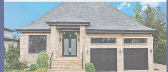
PROMESSE D'ACHAT ACCEPTÉE | 1 598 000 $