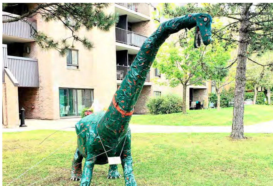
Bientôt de nouveaux projets de M. Rousseau. (Photo : courtoisie) (Photo : courtoisie)

Avez-vous aperçu le dinosaure devant la résidence de M. Rousseau? versants.com