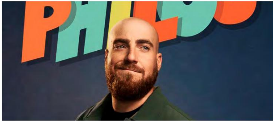
Phil Roy sera en spectacle à Saint-Bruno le samedi 24 septembre prochain.

L'humoriste Phil Roy présentera son deuxième one-man-show ici à Saint-Bruno-de-Montarville le 24 septembre prochain au centre Marcel-Dulude.