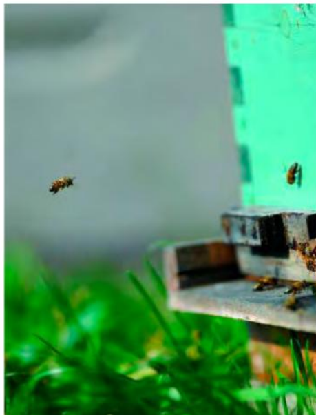
La mortalité hivernale des abeilles est un phénomène naturel au Canada. Dans la province, elle s'établit en moyenne à 21 % au cours des cinq dernières années.

Mais cette année, c'est le varroa destructor, un parasite arrivé au Québec au début des années 90, qui serait en cause. La floraison hâtive, les écarts au thermomètre pendant l'hiver et les saisons estivales qui se prolongent sont des symptômes de changements climatiques qui confèrent au varroa des conditions idéales pour proliférer.