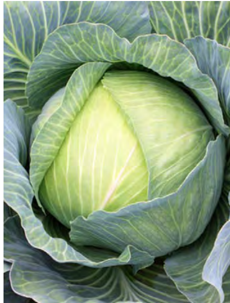
Un chou.