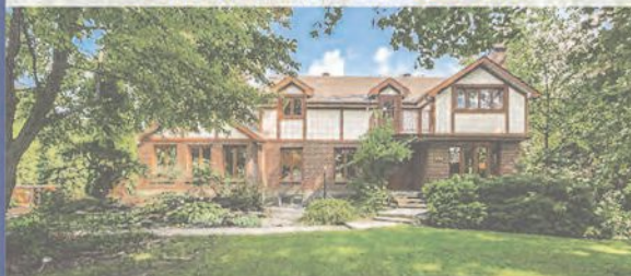
NOUVEAU SUR LE MARCHÉ | 749 000 $