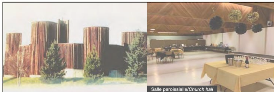
Salle paroissiale/Church hall