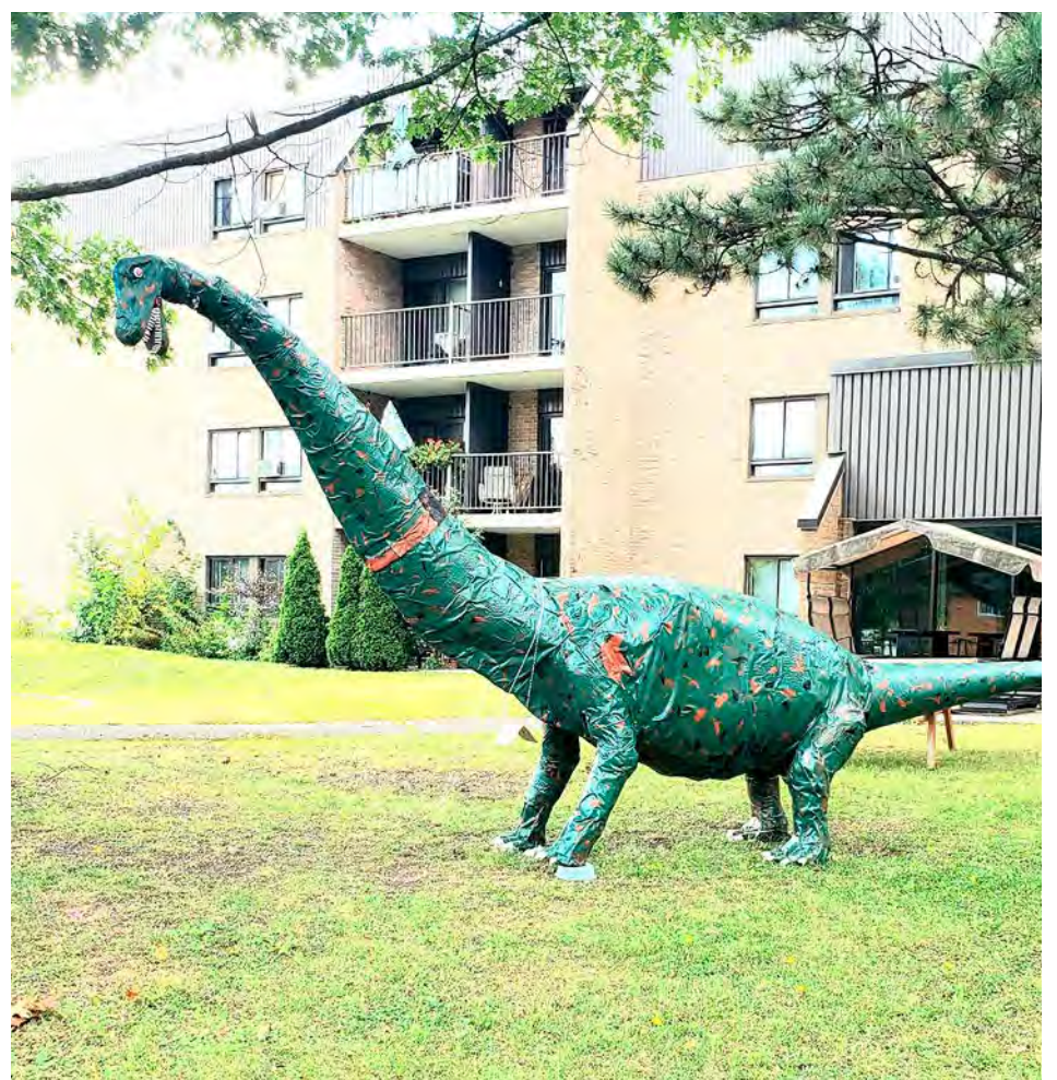
Le dinosaure fait environ 10 pieds de haut et 26 pieds de long.