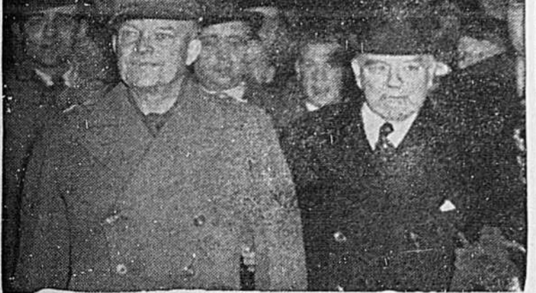
Le premier ministre MacKenzie King souhaite la bienvenue au général de l'Armée Dwight D. Eisenhower à l'arrivée de ce dernier à Ottawa. Les citoyens de la capitale ont fait un bel accueil à l'ancien commandant en chef des Armées alliées.

Les ventes d'énergie électrique ont rapporté $20,805,955, soit $1,276,011 de moins qu'en 1944, à cause d'une moindre demande d'énergie permanente de la part des industries de guerre. Les revenus de provenance diverse, au montant de $1,180,244, ont accusé une diminution de $11,180,