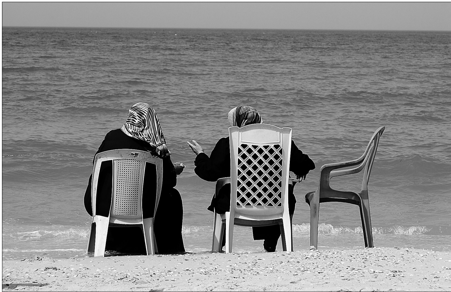
Un petit coin de plage où les Palestiniens peuvent profiter de la Méditerranée.

Et ce n'est pas fini : un véritable terminal qui, de l'extérieur, a des allures d'aérogare, est en construction à la sortie de Gaza. L'affiche qui, à notre arrivée, nous souhaite « Bienvenue à Erez » sonne presque comme une mauvaise blague.