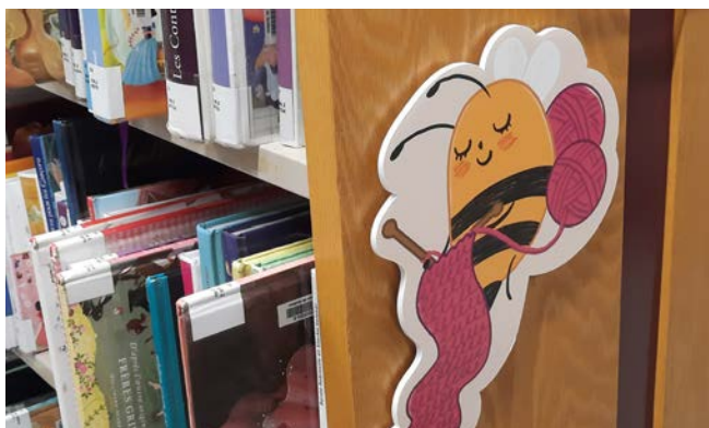
Cherche et trouve Mission abeilles : une abeille tricote dans les rayonnages. Illustration: Annie Carboneau

Pendant les premiers mois de l'année, la programmation culturelle s'est tenue en ligne. La Bibliothèque de Québec a poursuivi les appels reconforts aux personnes aînées, offert des conférences, des contes et des formations en ligne en plus de proposer des défis de science et de blocs Lego pour la relâche. De nouvelles initiatives ont été diffusées dont les Coups de cœur sous le lampadaire qui proposent des suggestions de lecture sur différents thèmes. L'ICQ a aussi produit les entretiens intergénérationnels Une jasette réunissant des personnes aînées et des adolescentes ou adolescents. En collaboration avec le festival Québec BD, des Tutos BD ont été diffusés en mode virtuel.