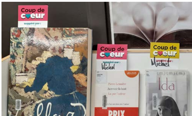
Les signets Coup de cœur pour identifier les suggestions de notre personnel

Le personnel a aussi été consulté en prévision d'une nouvelle formation au service à la clientèle afin de connaître leurs besoins. Des signets Coup de cœur ont été mis en place afin de faire bénéficier la clientèle de l'expertise de notre personnel. Une mise en commun des suggestions est disponible dans notre intranet afin de partager les découvertes de l'équipe et de s'inspirer mutuellement.