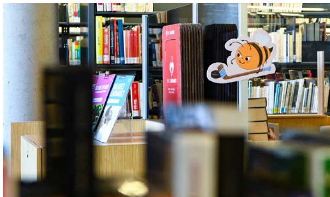
Cherche et trouve Mission abeilles : une abeille joue au hockey dans les rayonnages. Illustration: Annie Carboneau

Pendant l'été, de nombreuses familles ont participé au jeu de «cherche et trouve» géant autour de la thématique Mission abeilles dans toutes les bibliothèques. L'exposition Mes voisines les abeilles complétait cette thématique à la bibliothèque Paul-Aimé-Paiement où l'on retrouve des ruches sur le toit végétalisé. Le Club de lecture TD a repris en bibliothèque au grand bonheur des enfants et un Sentier des contes a été installé à proximité de quelques bibliothèques. Le projet-pilote de bibliothèque gourmande s'est déployé