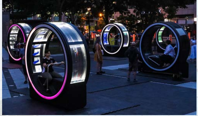
L'installation LOOP présentée à la place de l'Université du Québec

Enfin, dans le cadre de ses activités en littératie numérique, L'ICQ a présenté LOOP à la place de l'Université-du-Québec. L' œuvre interactive aux allures rétrofuturistes est activée par le public qui découvre des dessins animés inspirés de la littérature québécoise accompagnés des sons d'une boîte à musique.