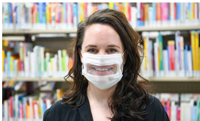
Masque avec fenêtre pour faciliter la communication avec les tout-petits et les personnes malentendantes.

Dès le début de la campagne de vaccination, le personnel des bibliothèques a soutenu les citoyennes et les citoyens pour la prise de rendez-vous de vaccination et la récupération de leur passeport vaccinal en ligne . L'équipe de la médiation numérique a offert des plages horaires pour les personnes qui souhaitaient un accompagnement personnalisé.