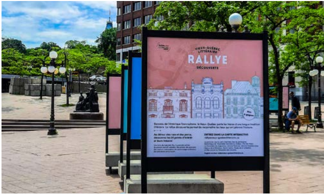
Exposition Vieux-Québec littéraire

À l'été, l'équipe a coordonné le premier rallye Vieux-Québec littéraire , une carte interactive enrichie des trésors de nombreux partenaires du quartier historique. Une version hivernale a aussi été proposée. La littérature a aussi pris d'assaut les parcs de Québec durant la saison estivale. Une brigade, formée de quatre artistes de la parole, a offert des poèmes lumineux, des slams enflammés, des contes surprenants ou encore, des récits intimistes aux passantes et passants.