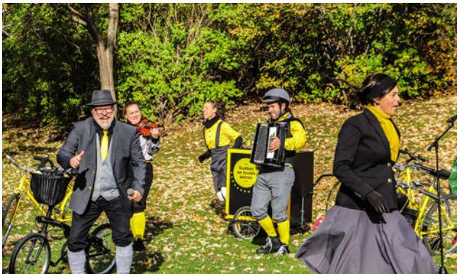
La caravane a apporté chaleur et féerie dans les parcs et les cours d'immeubles d'habitation.