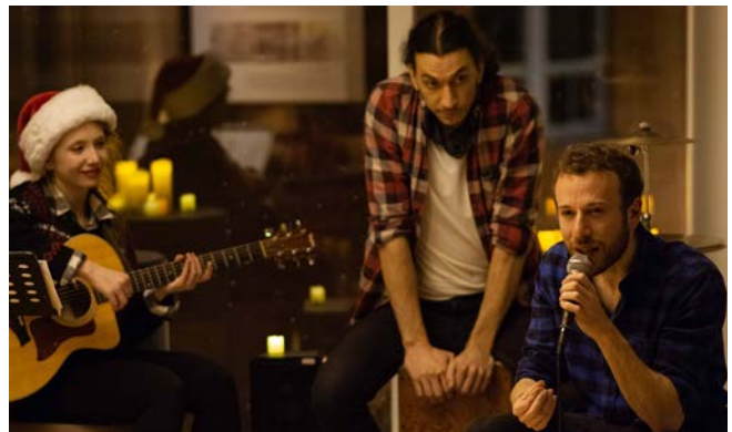
La Nuit d'après-ski

La vie littéraire à la Maison de la littérature a été effervescente. Entre la reprise des activités de programmation sur la scène littéraire et les collaborations nombreuses avec des partenaires, l'équipe a également développé de nombreux projets numériques et mis en place deux nouvelles résidences d'écriture : la Résidence d'écriture pour les Autochtones et la Résidence d'écriture pour la relève de 36 ans et plus.