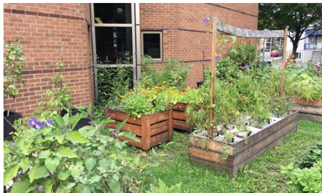
Jardin collectif à l'arrière de la bibliothèque Saint-Albert

à la bibliothèque Saint-Albert avec une grainothèque, des activités et un jardin collectif à l'extérieur. Le rallye estival Bibliothèques en lumière invitait la population à faire la tournée des bibliothèques pour découvrir les installations de l'artiste Vano Hotton installées devant plusieurs bibliothèques. Un duo père-fils a même fait la tournée des 26 bibliothèques à vélo, empruntant un document dans chaque lieu!