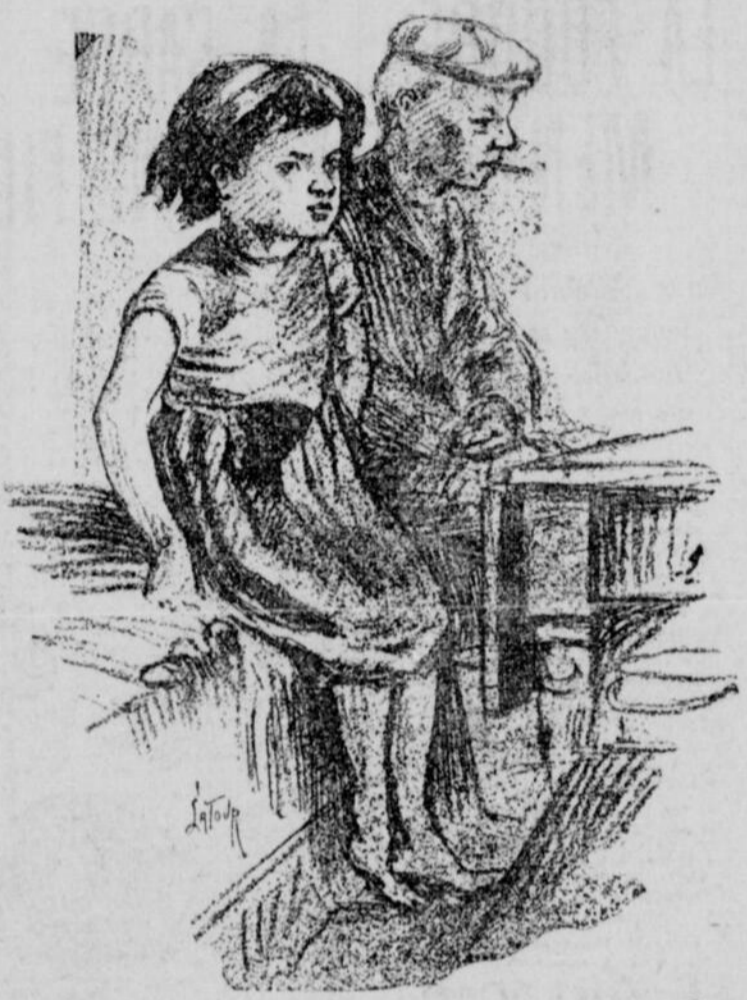
LES PETITS CLAVET, que leur père abandonne dans la rue (Croquis d'un artiste de la PATRIE).

Il nous conduit chez lui et nous raconte