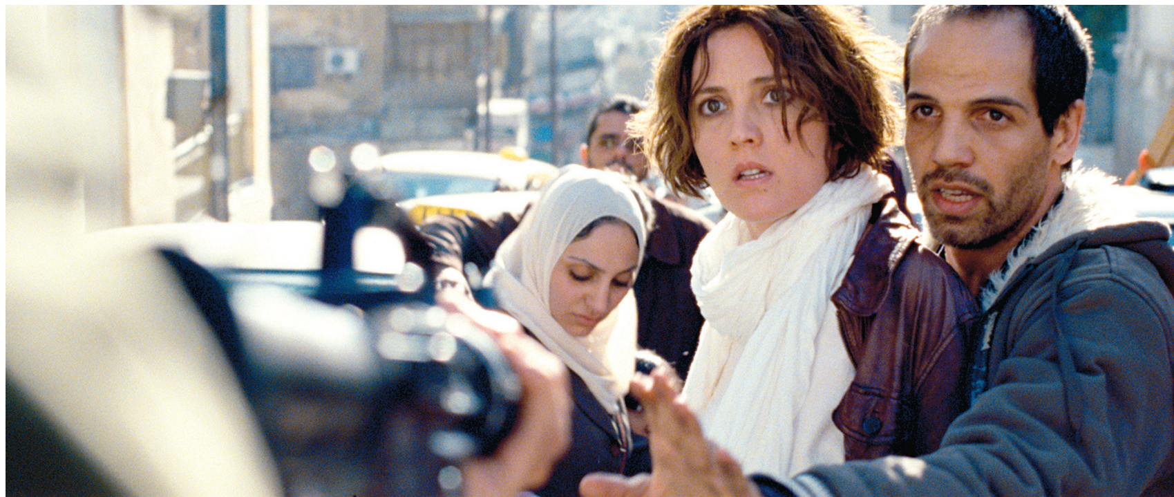
LES FILMS SÉVILLE

Inch'Allah suit le trouble intérieur de Chloé, une obstétricienne vivant en Israël mais travaillant dans une clinique de Cisjordanie, devant l'omniprésence de la violence et des injustices commises envers la population cisjordanienne.