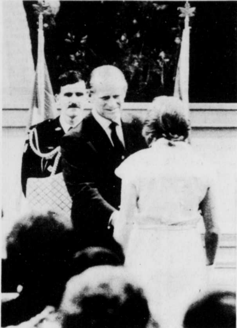
De passage à Ottawa, hier, le prince Philip a remis des parchemins à plusieurs jeunes Canadiens qui se sont distingués dans des activités de loisirs ou dans des voyages d'exploration.