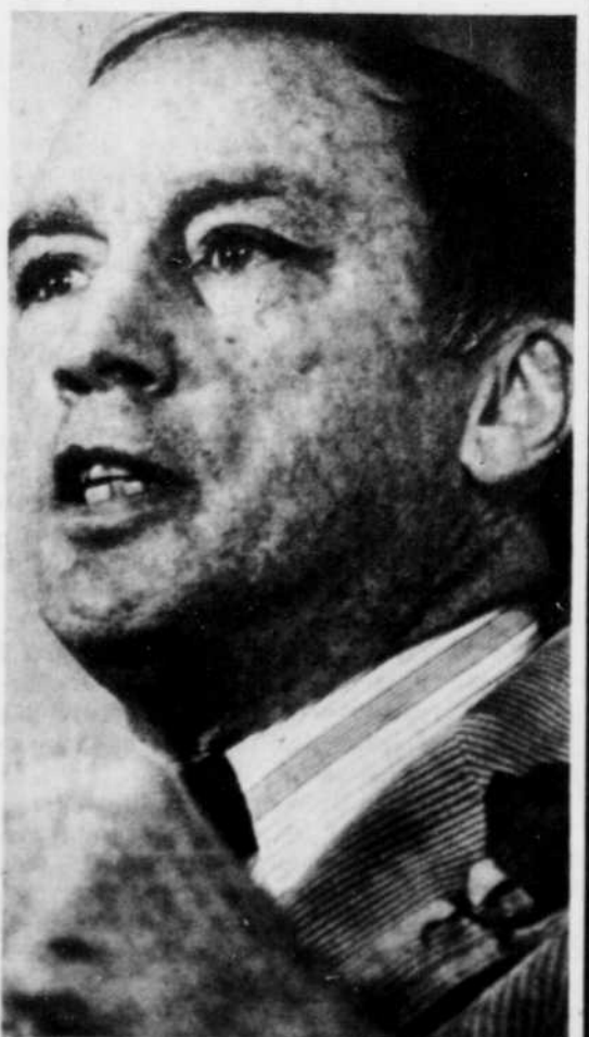
Pierre E. Trudeau