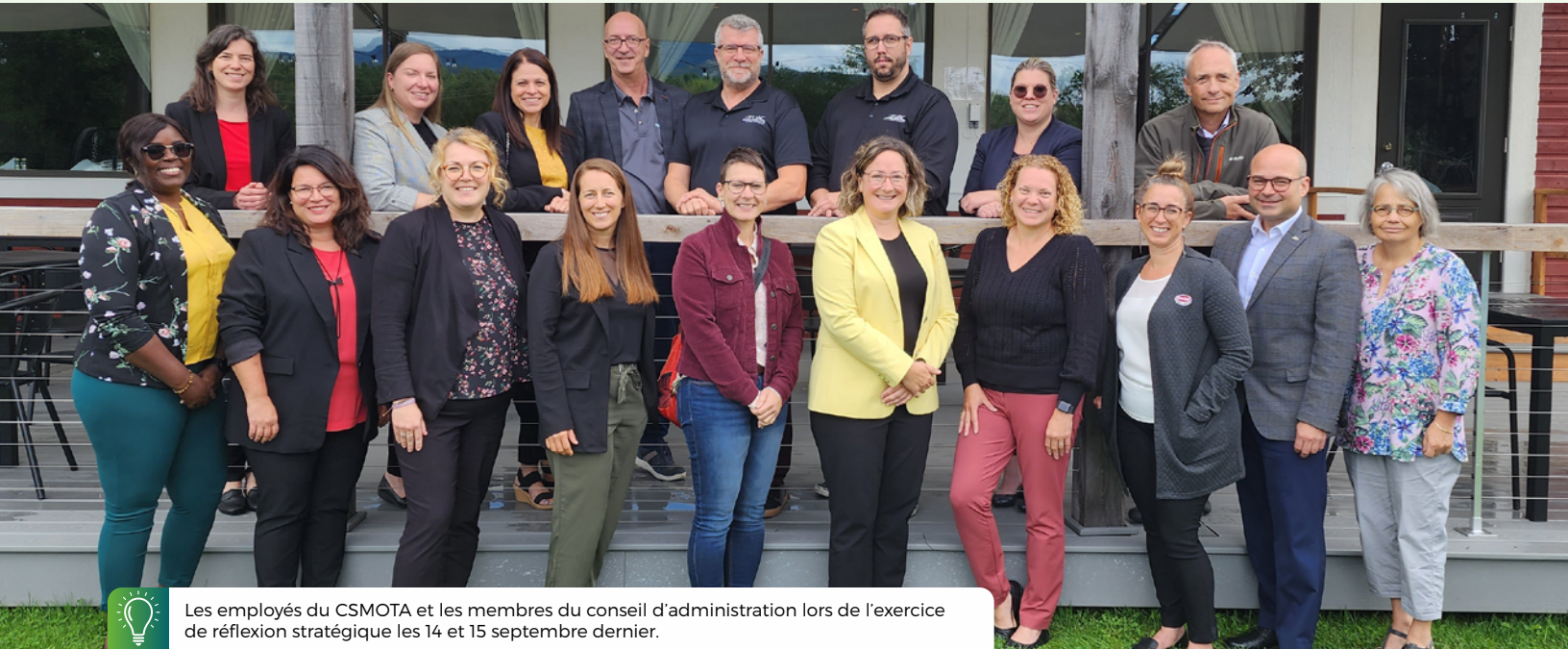
Les employés du CSMOTA et les membres du conseil d'administration lors de l'exercice de réflexion stratégique les 14 et 15 septembre dernier.