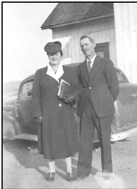
Maman et Papa, plus tard dans leur vie