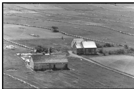
Notre première ferme