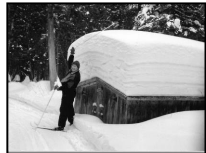
Moi au club La Coulée à Saint-Fabien