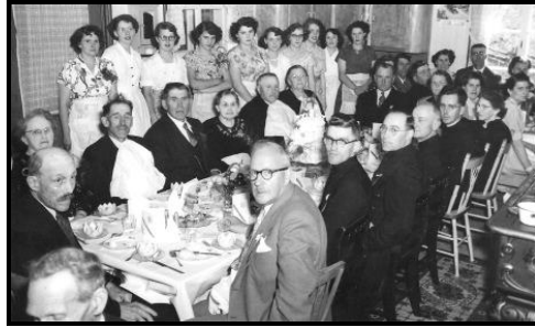
Voici un exemple des réceptions que nous faisons dans le temps. Je suis la 2 ième servante... en partant de la gauche.