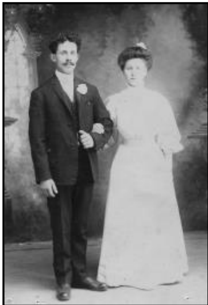
Le jour de leur mariage