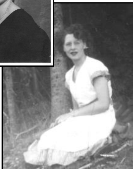
Mes années de jeunesse