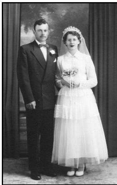
Notre photo de mariage