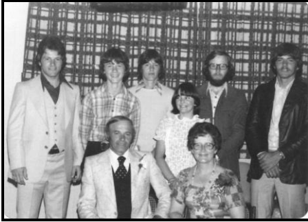
La famille à notre 25 e anniversaire de mariage en 1977