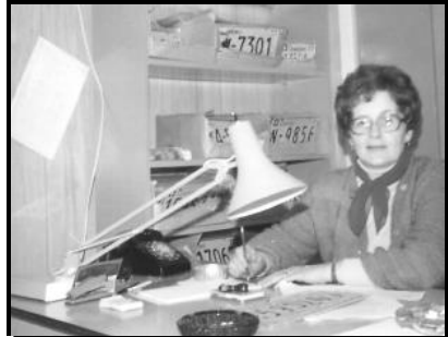
Le bureau des licences