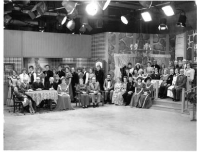
La soirée canadienne à Sherbrooke