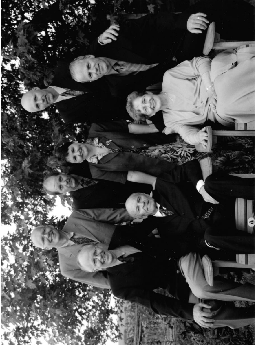
Ma famille, été 2004, à la fête des Belzile.