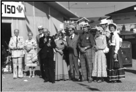
Les fêtes du 150 e de Saint-Fabien. Je suis complètement à droite