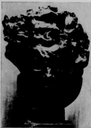
Beethoven (Sculpture d'Antoine Bourdelle)