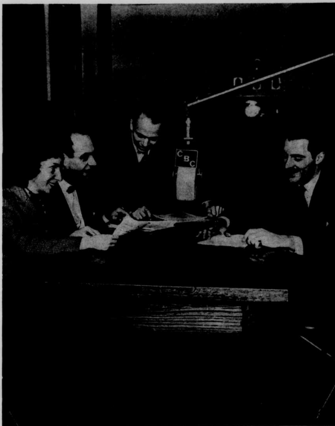
Au départ du "P'tit train du matin"

Radio-Canada vient de publier son rapport pour l'année 1949-50. Il accuse un déficit d'environ un quart de million et la Société signale que l'augmentation des revenus a été bien inférieure à celle des dépenses et que son budget actuel ne lui permet pas de satisfaire à tous les besoins.