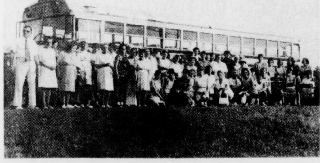
Le Conseil du bien-être de Thetford Mines avait également organisé un voyage au jardin zoologique à Charlesbourg. Il n'a sûrement pas loupé son coup à en juger par le nombre de personnes présentes sur la photo.

Il est impossible de douter de la valeur et de la popularité de celui-ci à en juger par la quantité de lettres de remerciements adressés au Conseil du bien-être de Thetford. Il ne nous reste plus en dernière instance, qu'à souhaiter que cet organisme bénéficie à la fin de son second mandat d'une autre extension afin qu'il poursuive le magnifique travail accompli jusqu'à présent auprès d'une grande partie des citoyens de Thetford et de ses environs.