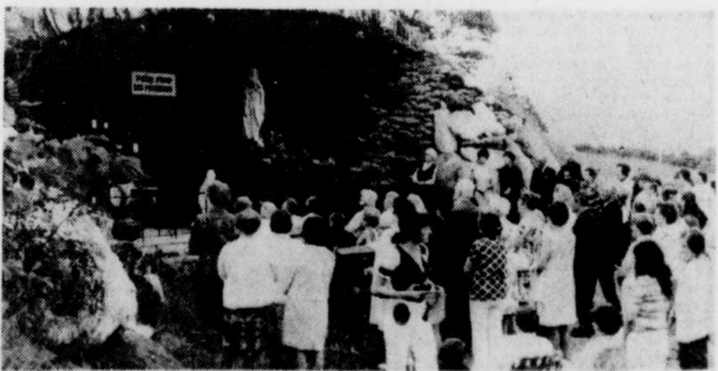
Cette photo a été prise lors d'un pèlerinage organisé par le Conseil du bien-être de Thetford Mines.