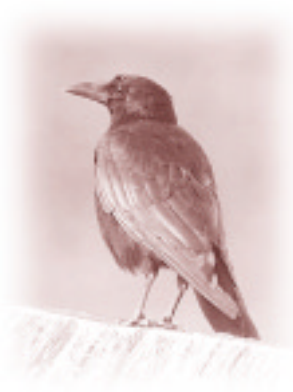
Huit corneilles et un geai bleu ont été retrouvés infectés par le VNO.