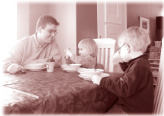
Être père, c'est valorisant! Être père, c'est différent!

C'est après avoir constaté et s'être inquiété de la faible participation des pères aux activités dédiées à la famille et à l'éducation des enfants que plusieurs organismes et organisations de la région ont décidé d'unir leurs efforts pour engager une action concertée de ralliement des pères. De la naissance de ce Regroupement découle le projet «Place aux pères».