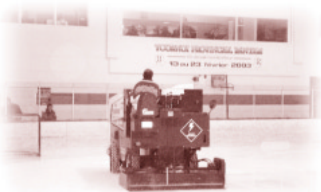
Pour l'aréna de St-Anselme... une surfaceuse électrique

Des concentrations excessives de gaz toxiques, tels le monoxyde de carbone (CO) et le bioxyde d'azote (NO 2 ) générés par des moteurs à combustion mal calibrés, peuvent entraîner des effets sérieux à la santé des travailleurs et des utilisateurs d'aréna : maux de tête, nausées, vomissements, toux inhabituelle, sensation de brûlure à la gorge, étourdissements, vertiges, essoufflement, et dans des cas plus graves, confusion, troubles visuels, perte de conscience, œdème pulmonaire et même décès.