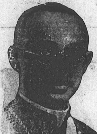
S. E. le Cardinal VILLENEUVE

"Le service de la Presse Catholique a donné à plusieurs journaux, tant de langue française que de langue anglaise, une analyse aussi fantaisiste que tendancieuse du document privé adressé par Nosseigneurs les archevêques et évêques de la province de Québec au clergé de leurs diocèses respectifs. D'autres rumeurs non moins inexacts ont cours, de même, en divers milieux.