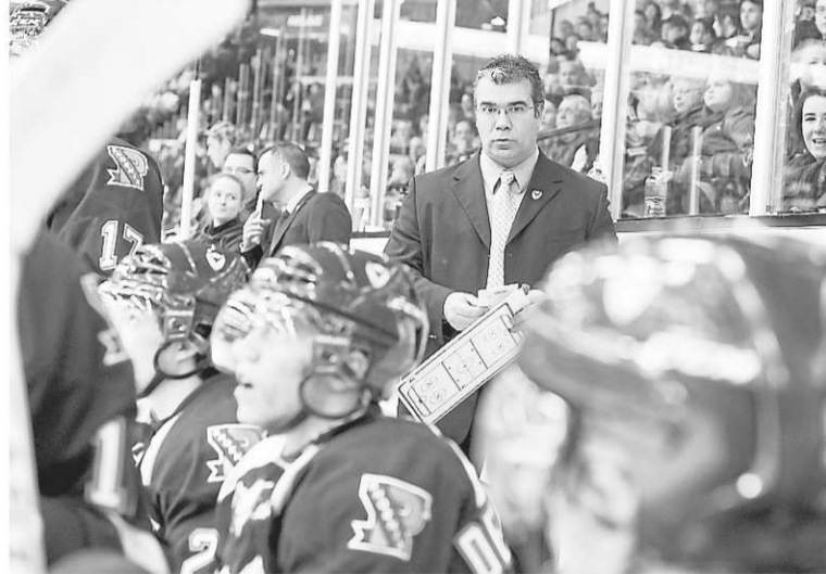
ARCHIVES LA TRIBUNE, JOCELYN RIENDEAU

« Benoit (Desrosiers) a sorti cette semaine les statistiques de l'équipe qui nous montrent qu'il y a eu des améliorations et une progression dans notre deuxième quart de la saison. Pour le reste de la campagne, tout va dépendre des transactions qui seront faites dans les prochains jours, ajoute l'entraîneur. Qui va rester? Serons-nous encore plus jeunes? Dans notre division, je ne pense pas que les autres équipes seront moins fortes après la période des transactions. » Vallée sait