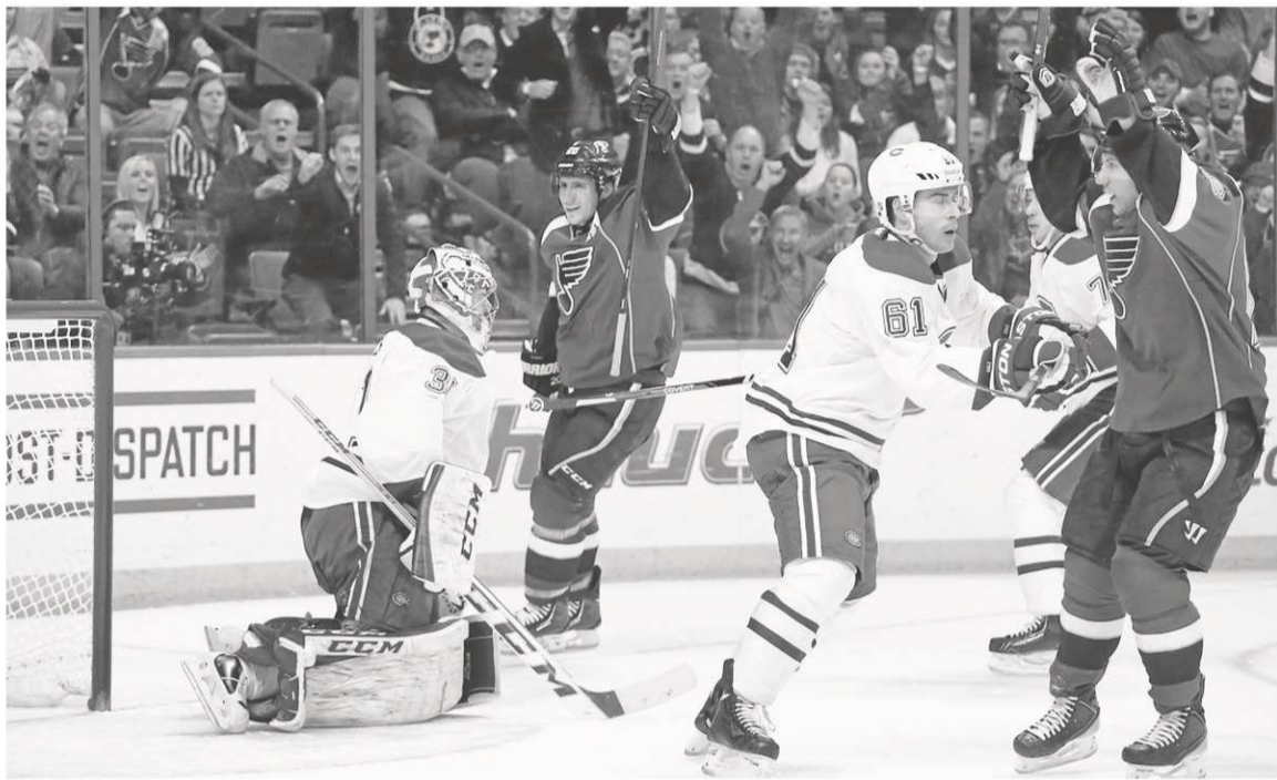
Alexander Steen se réjouit après avoir marqué son second but de la soirée, malgré les efforts de Carey Price et Raphael Diaz.

L'attaquant Alexander Steen, qui vient à peine de dire oui à un nouveau contrat de 17,4 millions de dollars sur trois ans, a célébré l'état de santé de ses finances personnelles en marquant les deux premiers buts