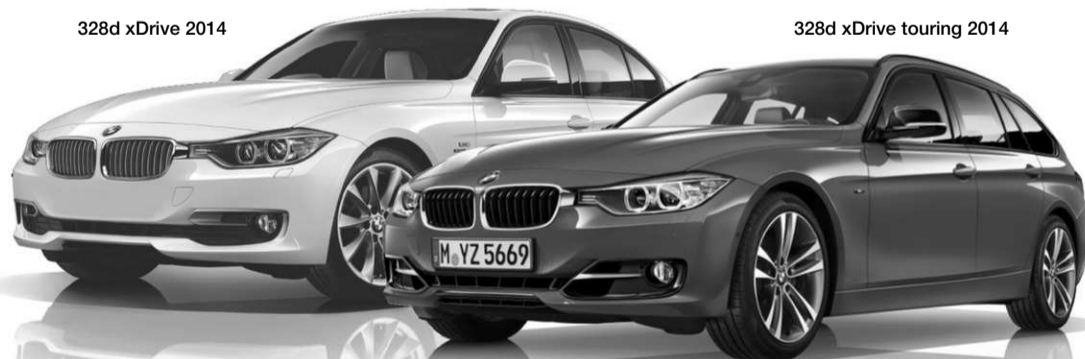
328d xDrive touring 2014