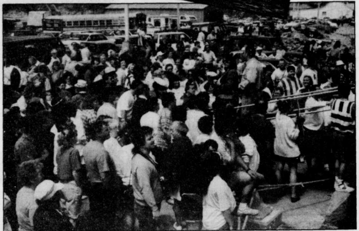
L'arrivée du Macassa Bay à Havre-Aubert n'est pas passée inaperçue. Une foule en liesse attendait patiemment le bateau de croisière.