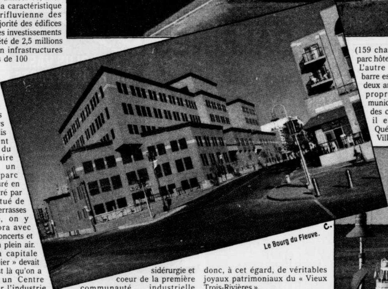
Le Bourg du Fleuve.

Après avoir ouvert un bureau d'information touristique, au 1563