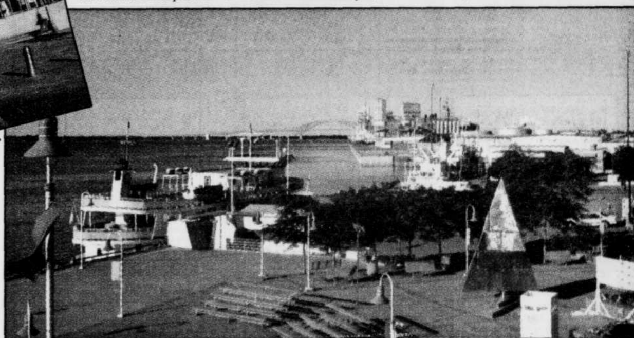
Le parc portuaire et, au loin, le pont Lavolette

coeur de la première communauté industrielle canadienne, les Forges du Saint-Maurice ayant été exploitées dès 1730 à des fins militaires et domestiques. Le monastère des Ursulines, les manoirs de Tonnancourt et de Niverville, la Maison de Gannes, l'église Saint James et la Vieille Prison sont