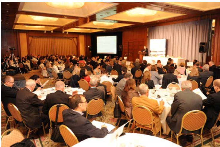
Plus de 150 dirigeants d'entreprises et d'associations patronales sectorielles ont participé en avril dernier au colloque du Conseil du patronat sur le projet de loi sur la modernisation du régime de santé et de sécurité du travail.

Pire encore, ce projet de loi, avec la lourdeur administrative et réglementaire qu'il entraînera pour les employeurs, contredit l'engagement du gouvernement à donner suite aux recommandations du rapport Audet sur la simplification des démarches administratives pour les entreprises.