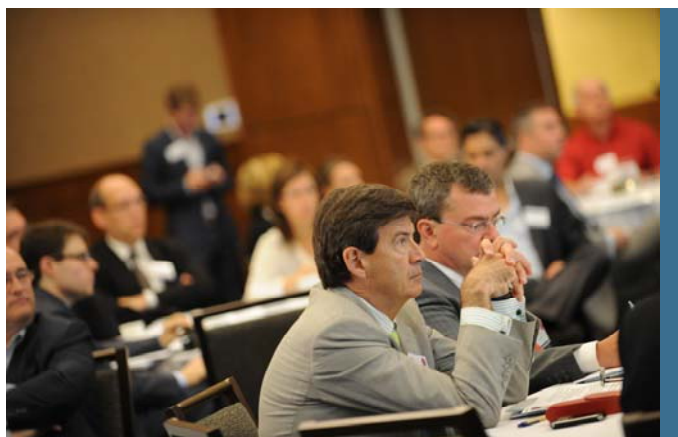
L'événement a réuni plusieurs gestionnaires et professionnels en rémunération et en ressources humaines.