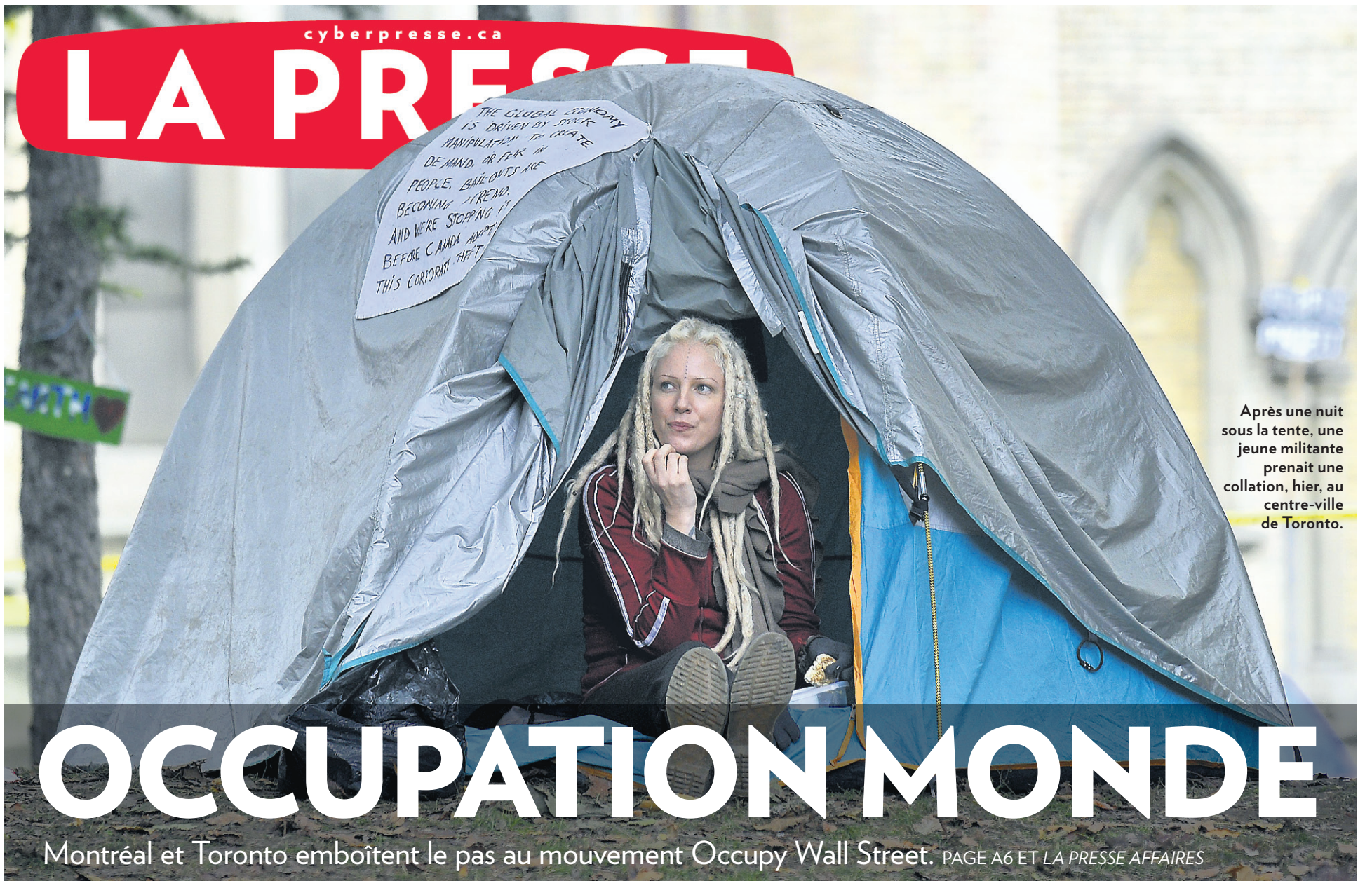
Après une nuit sous la tente, une jeune militante prenait une collation, hier, au centre-ville de Toronto.