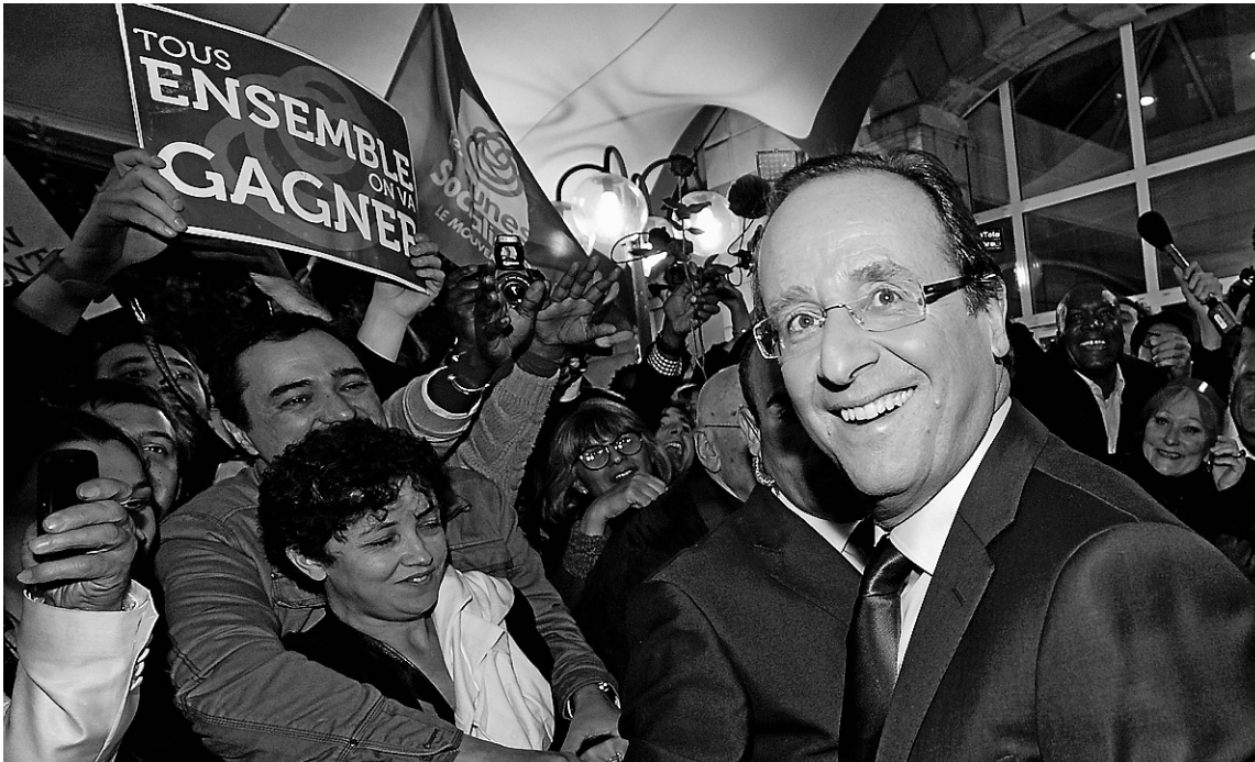
François Hollande a tendu la main à sa concurrente Martine Aubry, qui avait multiplié les déclarations agressives à son encontre dans l'espoir de rattraper le terrain perdu.

Il a profité de l'occasion pour tendre la main à Martine Aubry, qui avait multiplié les déclarations agressives à son encontre entre les deux tours