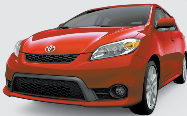
Modèle XRS illustré

DES RABAIS À L'ACHAT COMPTANT SUR CERTAINS MODÈLES 2011 ALLANT JUSQU'À 7 500$* SEULEMENT AU QUÉBEC*