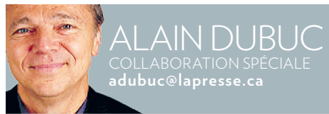
ALAIN DUBUC COLLABORATION SPÉCIALE adubuc@lapresse.ca

Pour les bureaucrates de Québec, la métropole montréalaise n'existe pas vraiment. Son territoire est au contraire dépecé et réparti entre cinq régions administratives différentes.