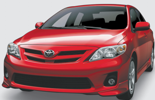
Modèle XRS illustré

Les Tunisiens résidant au Canada pourront finalement voter pour leurs représentants. L'organisme chargé de l'organisation du scrutin l'a annoncé hier dans un communiqué, sans fournir d'explication. Le Canada a manifesté ces dernières semaines son agacement d'être inclus dans la circonscription extraterritoriale d'un pays étranger. Des fonctionnaires ont cependant reconnu qu'Ottawa pouvait difficilement empêcher les ressortissants étrangers de tenir un scrutin. Les Tunisiens de Montréal et de l'est du Canada pourront voter à leur consulat ou à l'Espace Famille, du 20 au 22 octobre prochain, de 7h à 19h. - Karim Benessaïeh