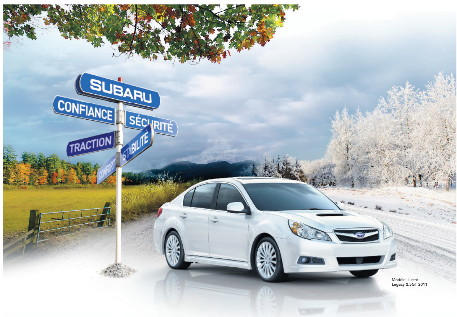
Modèle illustré : Legacy 2.5GT 2011

Santé publique Ottawa n'a pas donné de détails sur la manière dont les gens auraient été contaminés, mais a promis d'en dire davantage dans les prochains jours. Il pourrait s'agir d'instruments mal stérilisés ou de manquements au code d'hygiène.