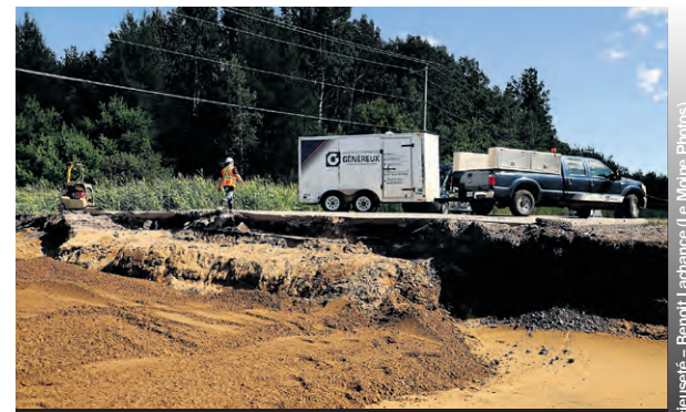
La réparation de la route 131 à Notre-Dame-de-Lourdes au lendemain des inondations.

Selon Pierre Corbin, président d'Hydro Météo, le 9 août a été la journée la plus pluvieuse du mois d'août toutes journées confondues depuis 1913 à Joliette. La municipalité de Lanoraie a reçu, à elle seule, 221 mm de pluie. « La rivière L'Assomption va produire un débit historique pour ce temps-ci de l'année. Nous aurons droit à un débit digne d'un bon printemps avec quelques inondations mineures », a indiqué Pierre Corbin.