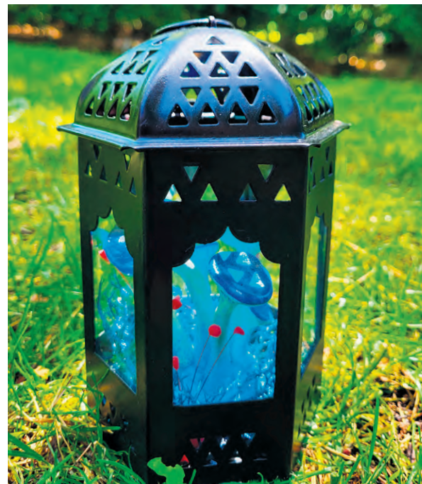
L'exposition mettra en scène des œuvres qui reflètent une nature fantastique.

Pour plus de détails : antoinelacombe.com . (JJ)