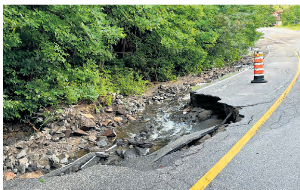
Certaines sections des routes peuvent être manquantes et les accotements fortement érodés.

On demande à ceux qui doivent absolument circuler sur le réseau routier d'être prudents puisque certaines sections des routes peuvent être manquantes et les accotements fortement érodés.