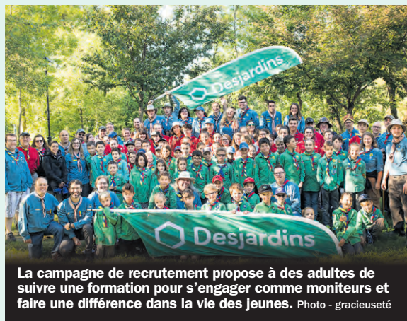
La campagne de recrutement propose à des adultes de suivre une formation pour s'engager comme moniteurs et faire une différence dans la vie des jeunes.