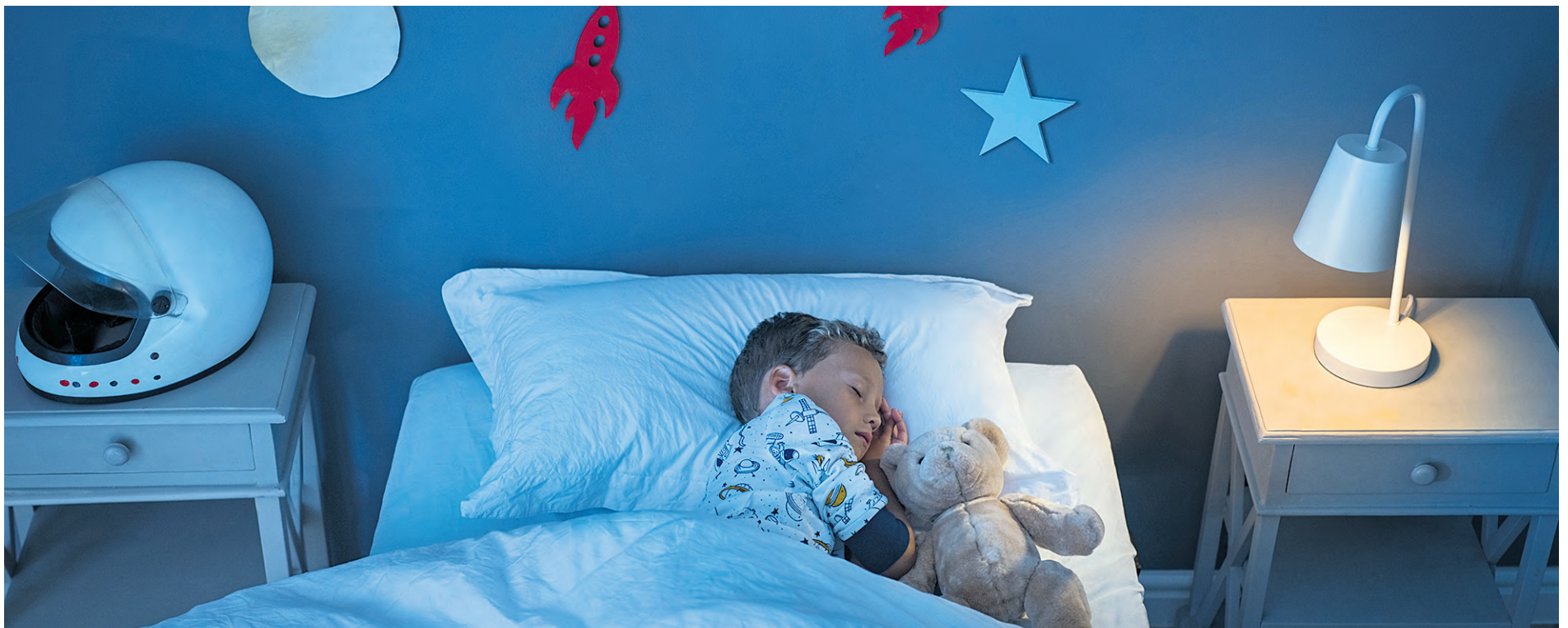
Le manque de sommeil affecte négativement les capacités cognitives.