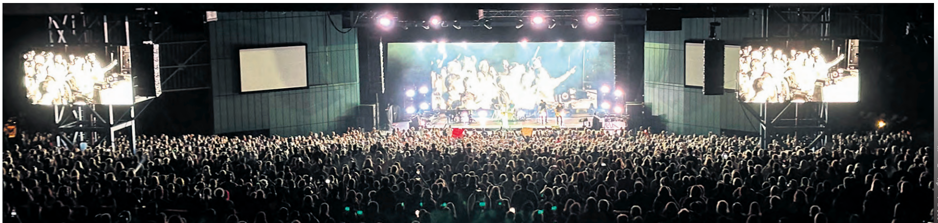
L'Amphithéâtre Fernand-Lindsay était plein à craquer le mercredi 7 août dernier pour le spectacle de Bryan Adams.