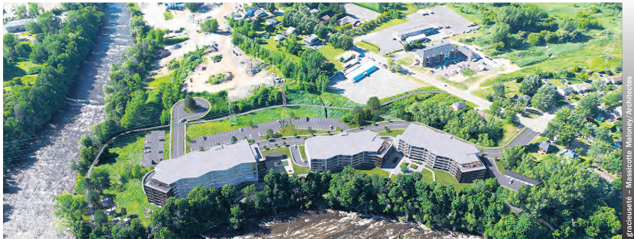
Le quartier Aqua Roca sera situé sur un terrain en contrebas du boulevard de la Base-de-Roc.

Ainsi, les Habitations Moderno souhaitent commencer l'aménagement des premières infrastructures, dont une nouvelle rue, tout comme du premier bâtiment dès l'automne de cette année. «La construction d'un édifice prend autour d'un an. Alors, nous prévoyons environ trois à cinq ans de travaux», estime M. Morneau. Les bâtiments seront d'ailleurs implantés sur un terrain en pente. De cette façon, l'édifice de sept étages ne paraîtra pas aussi haut puisque seulement deux ou trois étages seront visibles du boulevard de la Base-de-Roc. «Nous sommes