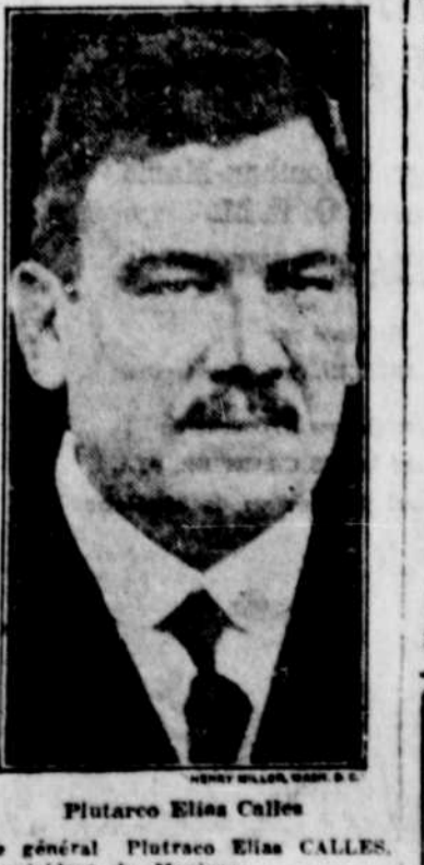
Plutarco Elias Calles, le général Plutarco Elias Calles, président du Mexique.

American Smelting pour les six mois finissant le 30 juin a gagné $11.65 par action ordinaire contre $7.59 en 1925.