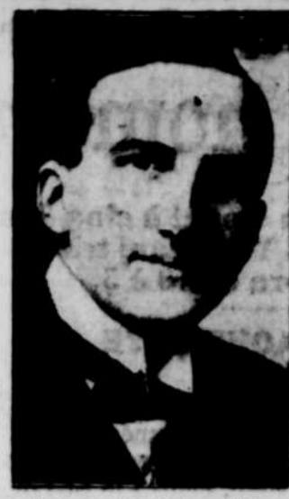
Lord Eustache PERCY, ministre de l'Education, dans le gouvernement Baldwin.

LISEZ les ANNONCES Les nouvelles du jour