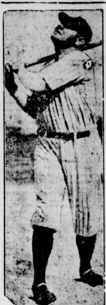
Babe RUTH, le roi des frappeurs, qui a établi une série de records pour les séries mondiales en frappant trois coups de circuit contre le St-Louis, hier.