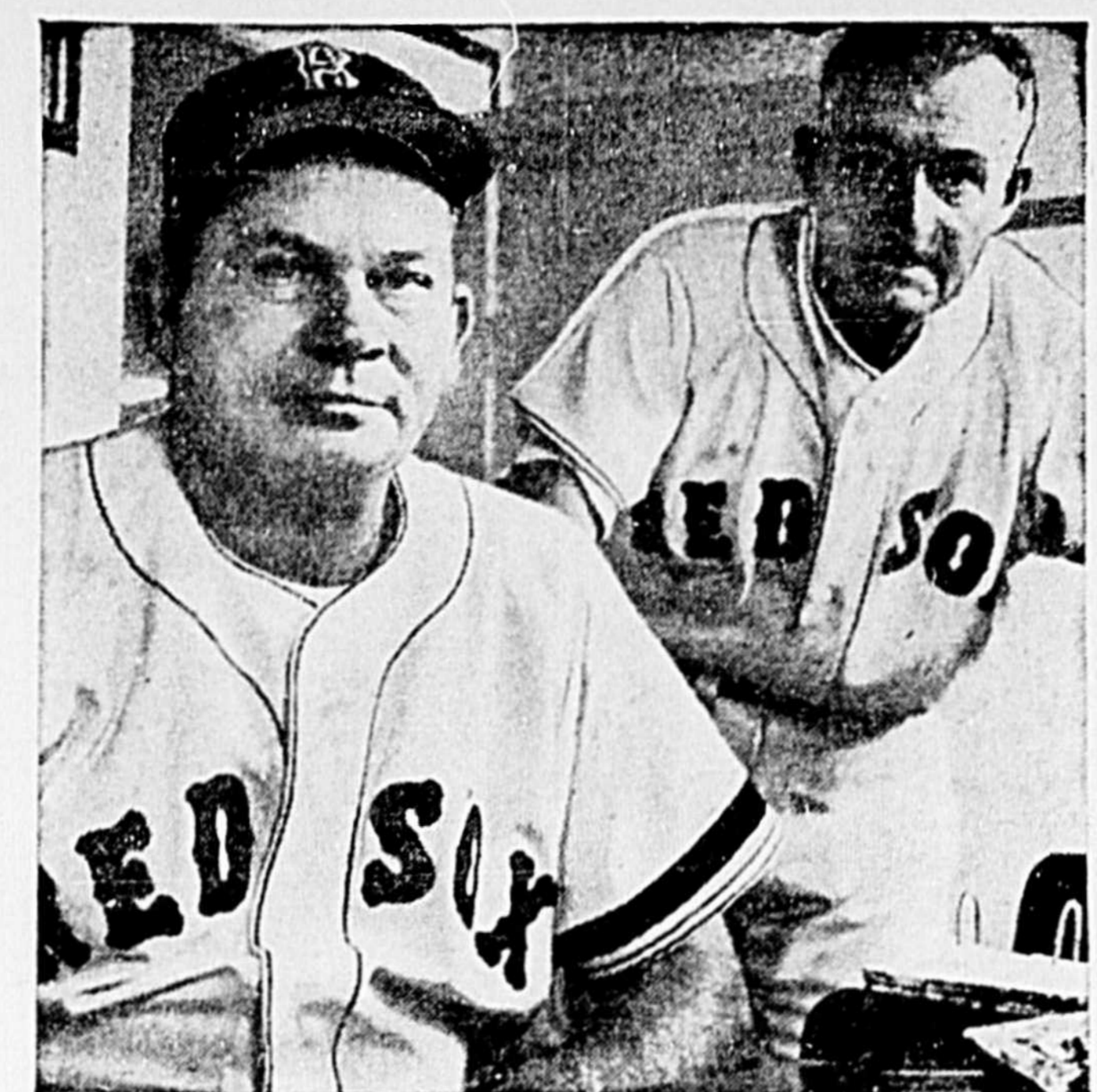
GERANT DE L'ANNEE: — Un candidat sérieux et logique pour le "gerant de l'année" dans le baseball majeur est bien Mike "Pinky" Higgins...