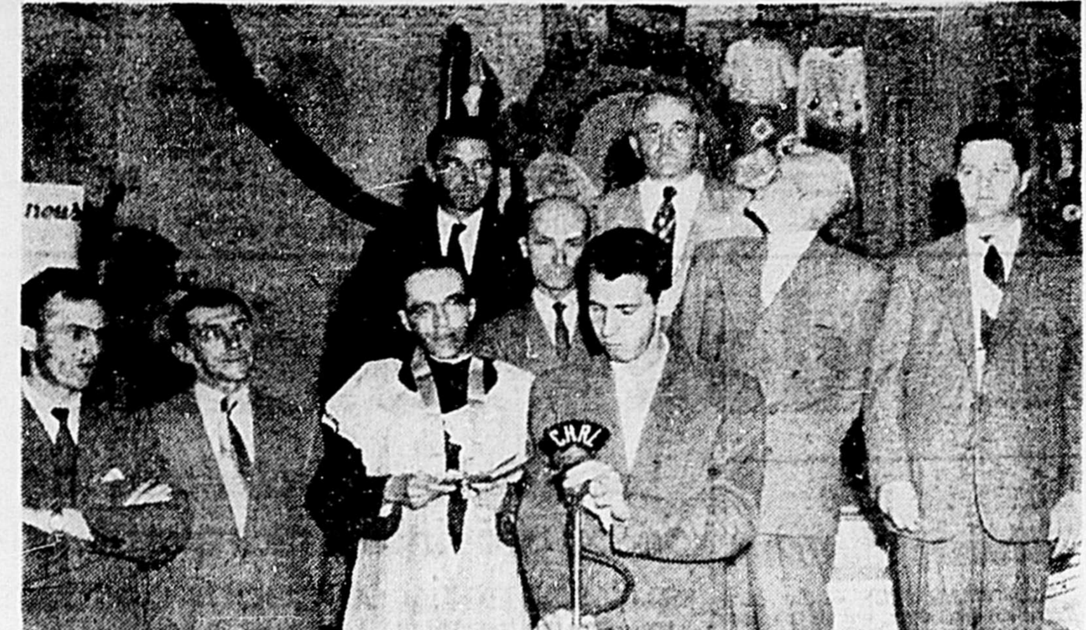
A L'EXPOSITION DE ST-FÉLICIEN: Photo prise tout dernièrement à St-Félicien lors de la seconde Exposition Industrielle et Commerciale.

Cependant, a-t-il ajouté, lors de la dernière élection en 1951 les communistes n'ont obtenu qu'une majorité de 120 voix.