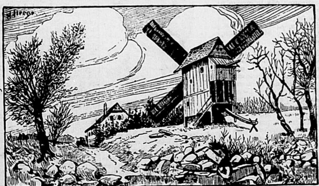
Où est le meunier ?

Quant aux personnes qui voudraient avoir la photographie de leurs chers défunts, elles sont priées de nous faire parvenir leur commande accompagnée du portrait de la personne, ayant le soin de nous indiquer le nom de cette personne, son âge, l'endroit du décès, la date et l'année. Nous prenons des commandes par n'importe quelle quantité et pouvons les expédier à n'importe quelle adresse.