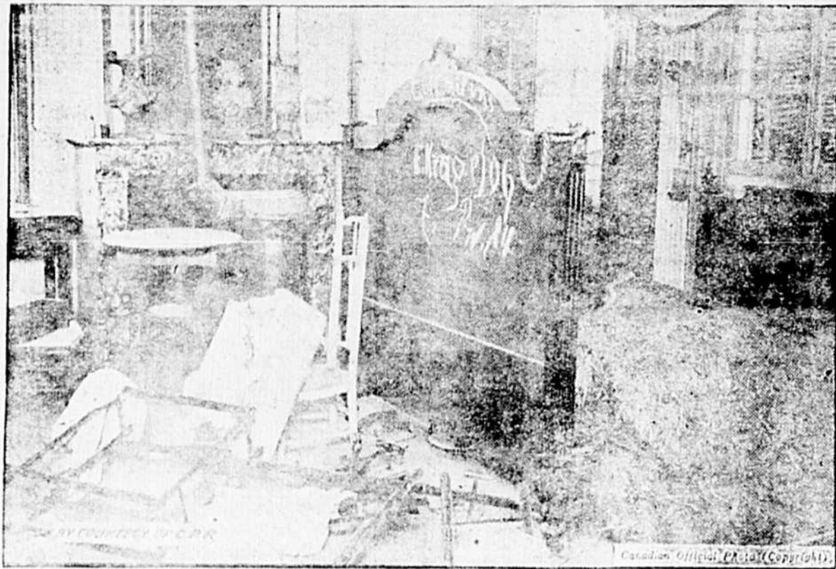
"Got Mit Uns": telle est l'inscription écrite à la craie, que l'on peut lire sur le lit de cette chambre, que les Allemands ont dévastée avant de quitter Cambrai.