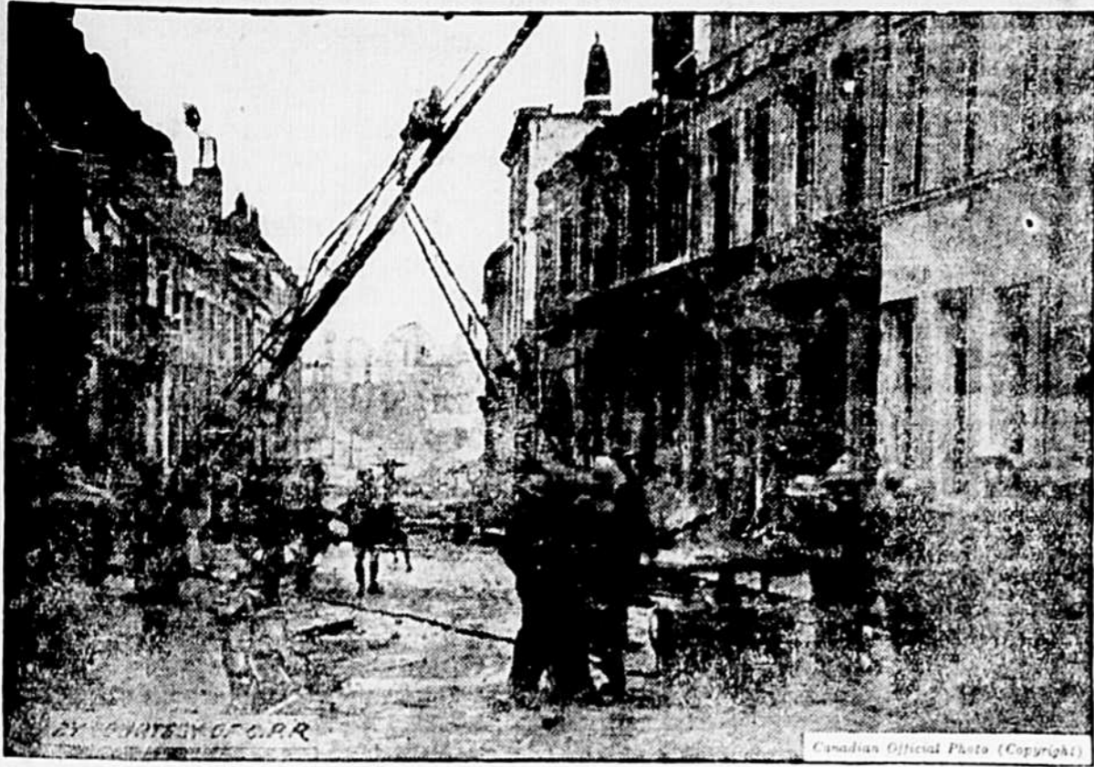
Dès leur arrivée à Cambrai, les Canadiens s'employèrent avec succès à éteindre les feux allumés partout par les Allemands avant leur départ pour leur pays.