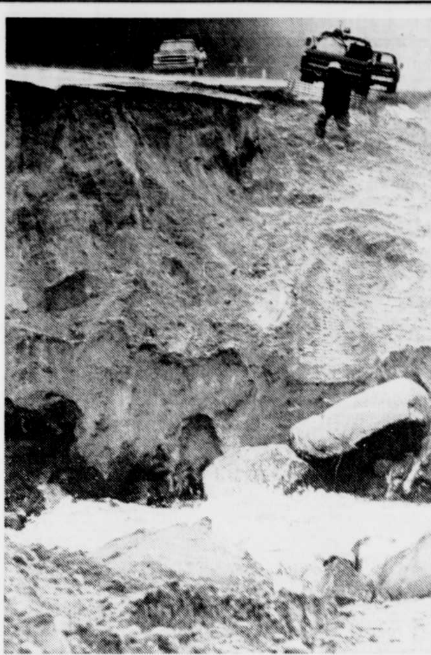
La pluie et les crues du dégel printanier ont miné la chaussée sur une distance de 30 à 40 pieds.

Saint-Jean, Terre-Neuve, 1,2 pour 100 (14,0); Charlottetown-Summerside, 0,8 pour 100 (14,0); Halifax, 0,7 pour 100 (11,9); Saint-Jean, Nouveau-Brunswick, 0,9 (13,1) Québec, 0,9 (12,3); Montréal, 1,0 pour 100 (13,2); Ottawa, 0,3 pour 100 (11,5); Toronto, 0,9 pour 100 (12,5); Winnipeg, 0,2 pour 100 (10,8); Regina, 0,1 pour 100 (11,8); Saskatoon, 0,4 pour 100 (11,6); Edmonton, 0,5 pour 100 (12,1); Calgary, 0,7 pour 100 (13,4); et Vancouver, 0,7 pour 100 (14,4).