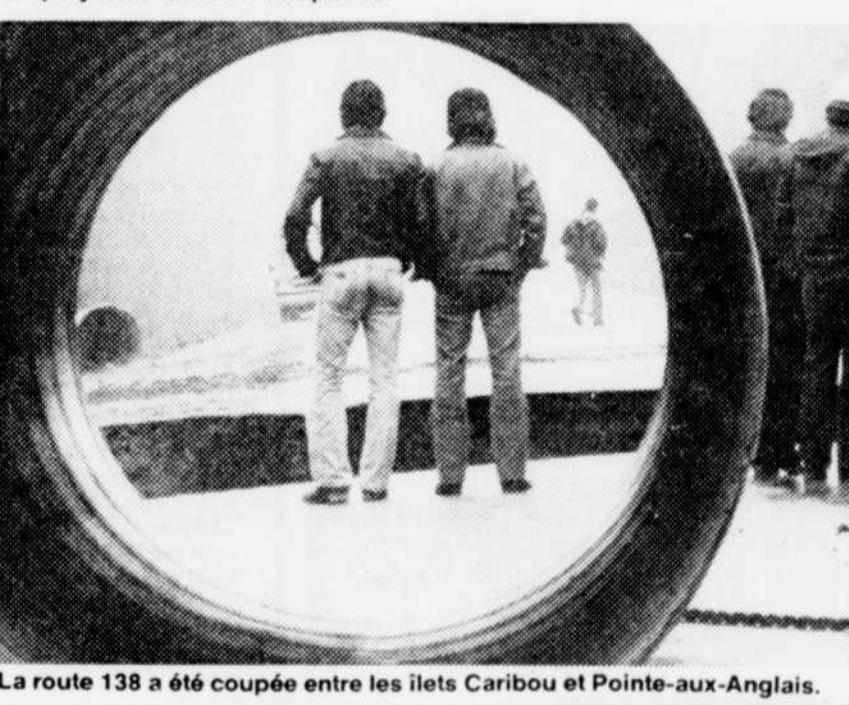
La route 138 a été coupée entre les îlets Caribou et Pointe-aux-Anglais.