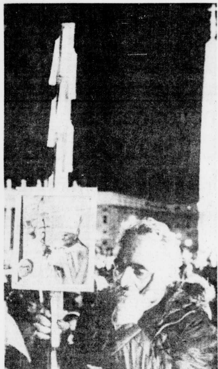
Plus de 30.000 fidèles se sont rassemblés hier soir place Saint-Pierre pour une vigile de prières.

Ils étaient tous habitants de la capitale et "profondément catholiques". Quatre ouvriers, un professeur d'éducation physique et un étudiant de 17 ans figurent parmi eux.