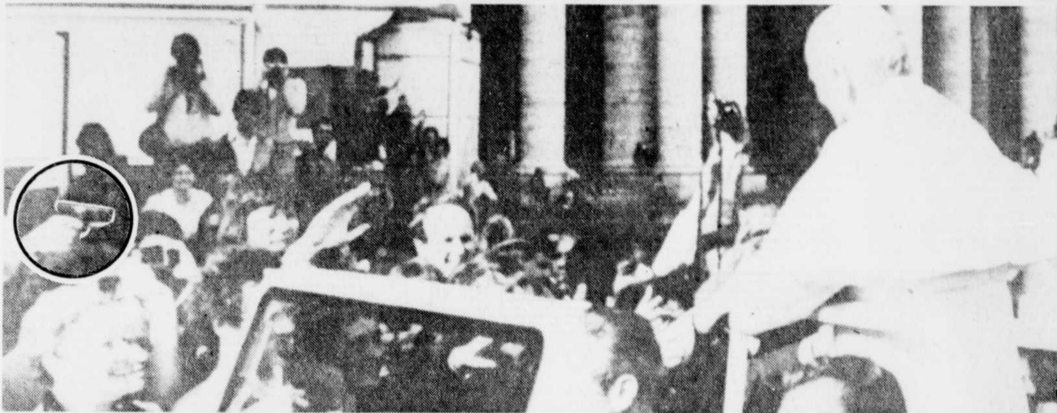
L'arme de l'assailant pointée vers le pape

A l'extrême gauche de la photo (en médaillon) la main de l'assailant braquant son arme vers le pape alors qu'il salue la foule réunie place Saint-Pierre. Un instant plus tard, Jean-Paul II était atteint de trois balles. Cette image a été tirée d'un film 8mm réalisé par une personne non identifiée et obtenue par l'Agence italienne de nouvelles ADN Kronos.