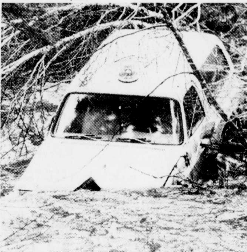
C'est finalement dans cette position que s'est retrouvée le 4x4 des employés de Québec-Téléphone.