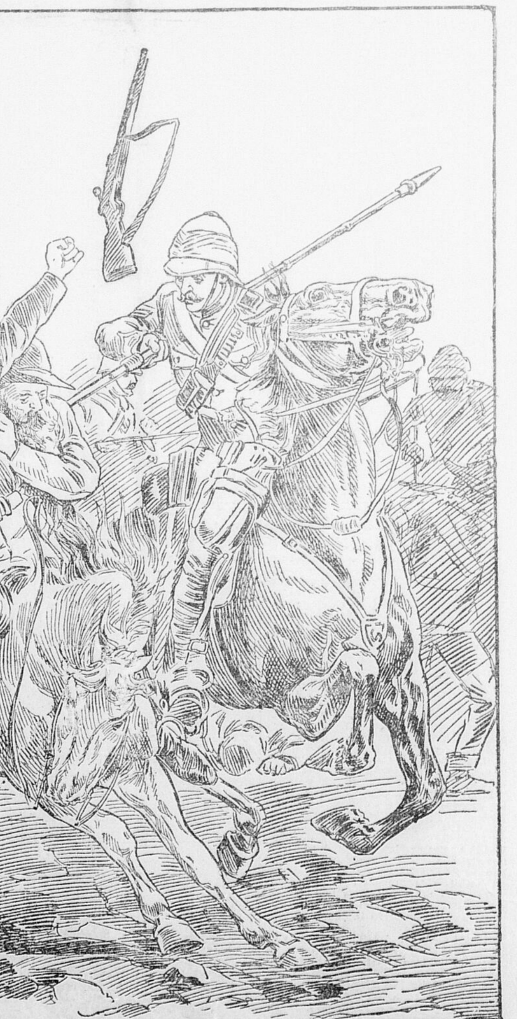
EPISODE DE LA GUERRE ACTUELLE AU TRANSVAAL.—Un lancier anglais tue deux Boers dans une affaire qui a eu lieu à Elandslaagte. Le lancier fut ensuite tiré et tué par les Boers.