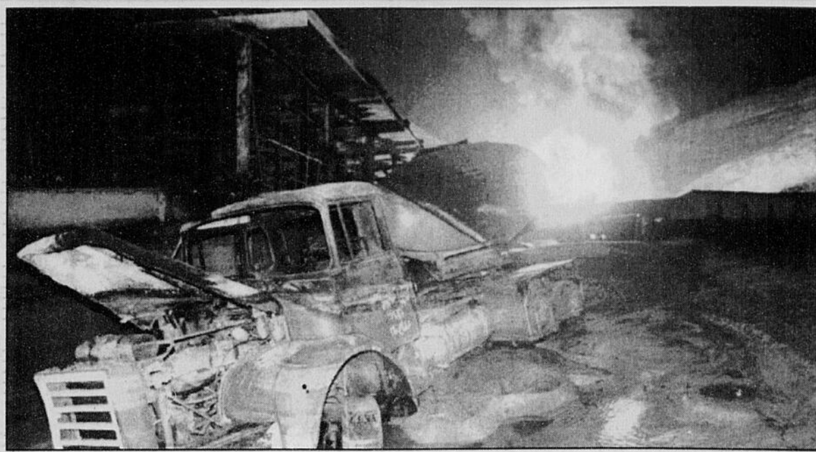
Plus de 410 personnes ont péri en Egypte à la suite d'un incendie provoqué par la foudre.