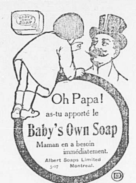
Oh Papa! as-tu apporté le Baby's Own Soap Maman a un besoin immédiat.

Les filles qui grandissent ont besoin des Pilules Roses. Ce tonique est nécessaire à leur développement normal pour leur assurer santé et force.