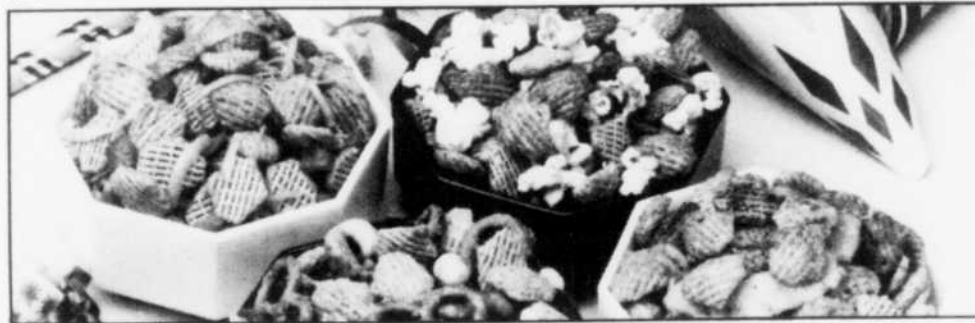
Des amuse-gueule croustillants et délicieux pour les grignoteurs.

P.S. Cette recette a été mise à l'épreuve dans un four micro-ondes de 700 watts. Augmenter les temps de cuisson pour des fours de moindre puissance.