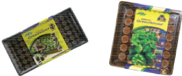
MINI SERRES 36 OU 72 CELLULES

HORAIRE RÉGULIER LUNDI 8H00@18H00 MARDI 8H00@18H00 MERCREDI 8H00@18H00 JEUDI 8H00@18H00 VENDREDI 8H00@18H00 SAMEDI 9H00@17H00