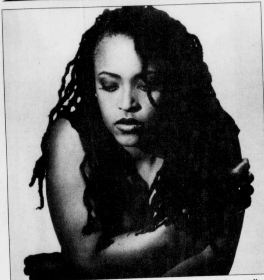
Avec sa voix puissante, son énergie, sa maîtrise rythmique et ses influences diversifiées, Cassandra Wilson pourrait causer une agréable surprise à ceux qui iront l'entendre vendredi aux Nuits Black.