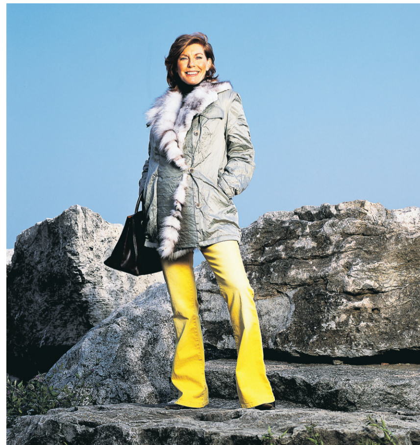
Manteau duvet et fourrure Hilary Radley

Pour trouver une bonne couturière, feuillotez les petites annonces de votre journal de quartier. Vous pouvez aussi mettre une demande sur le tableau d'affichage du centre de couture près de chez vous ou à l'épicerie du coin.