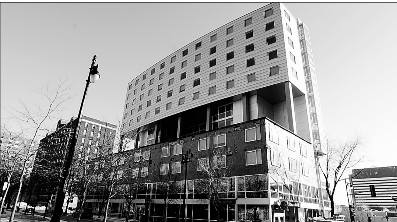
La Maison du prêt d'honneur, située à l'intersection au coin Saint-Laurent et René-Lévesque.