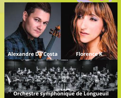
Il était une fois Ennio Morricone Vendredi 17 juin, 19 h 30 Cocathédrale Saint-Antoine-de-Padoue Longueuil