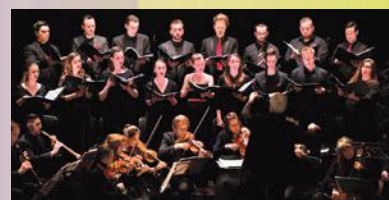
Vespro della Beata Vergine Dimanche 5 juin, 19 h 30 Église Sainte-Famille, Boucherville