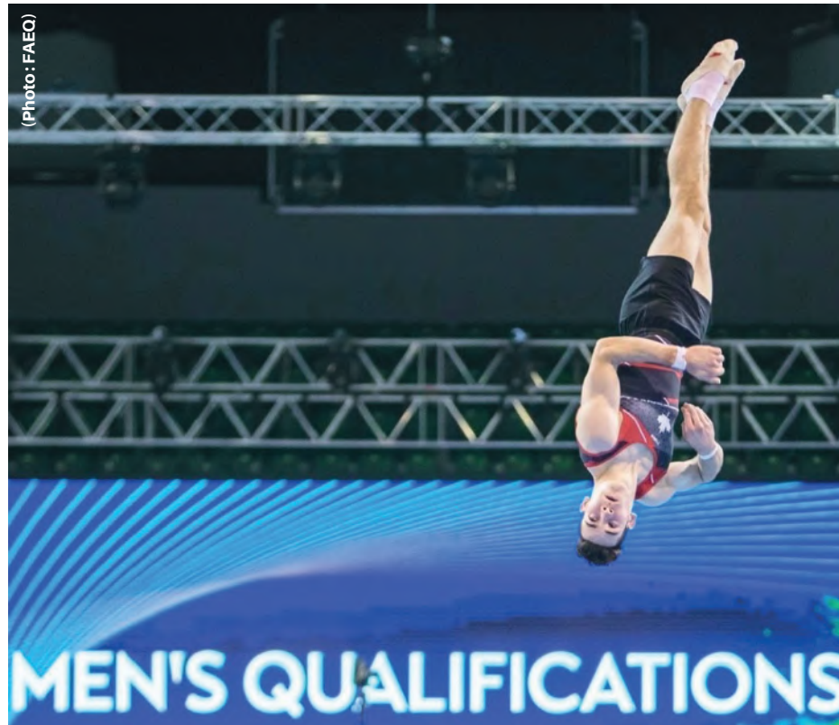
Les brillants résultats du Julievillois de 20 ans lui ont permis de se tailler une place sur l'équipe nationale senior.