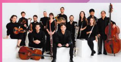
Messa di Gloria de Puccini Vendredi 27 mai, 19 h 30 Basilique Sainte-Anne de Varennes