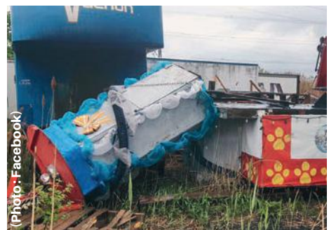
Le char de la Pat Patrouille ne pourra pas être disponible pour de l'animation lors du passage de la Boucle du Grand défi Pierre Lavoie, le 11 juin à Sainte-Julie.