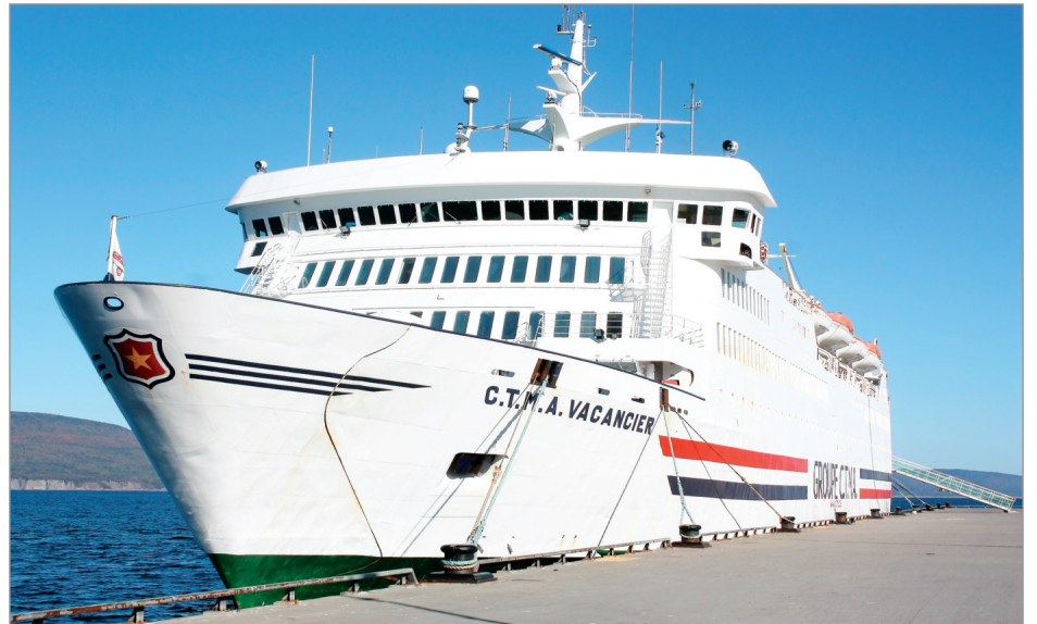
Le CTMA Vacancier transporte plus de 450 passagers et 100 membres d'équipage

Pour cette dernière escale gaspésienne, le public était invité à venir visiter le CTMA Vacancier avant son retour dans la métropole. Les gens ont ainsi pu se faire une idée précise des nombreuses commodités offertes aux passagers: bar, restaurant, boutique d'artisanat, salon de coiffure... En tout, on peut dire qu'environ 300 personnes ont profité de l'occasion pour voir le traversier de l'intérieur ce jour-là.