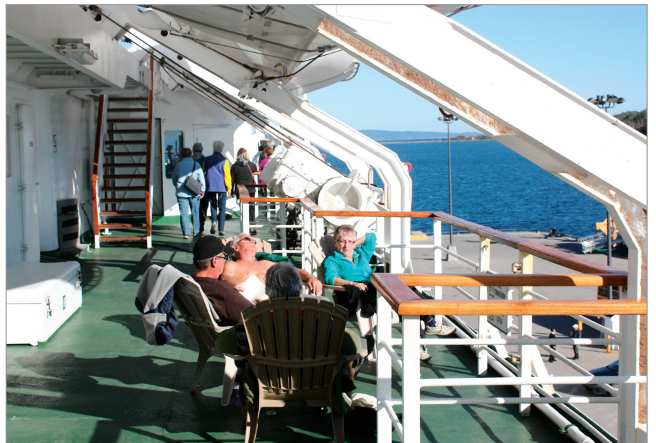
Le meilleur endroit pour prendre quelques heures ou encore quelques journées de bon temps...