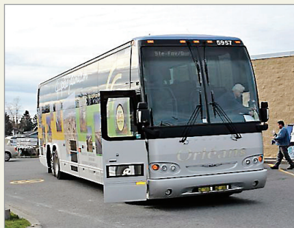
L'heure sera bientôt aux décisions dans le dossier d'Orléans Express.

À l'issue de cet exercice, l'entreprise réitère sa volonté de continuer à offrir des services de transport interurbain par autocar au Québec dans l'avenir, mais une aide devra y être apportée.