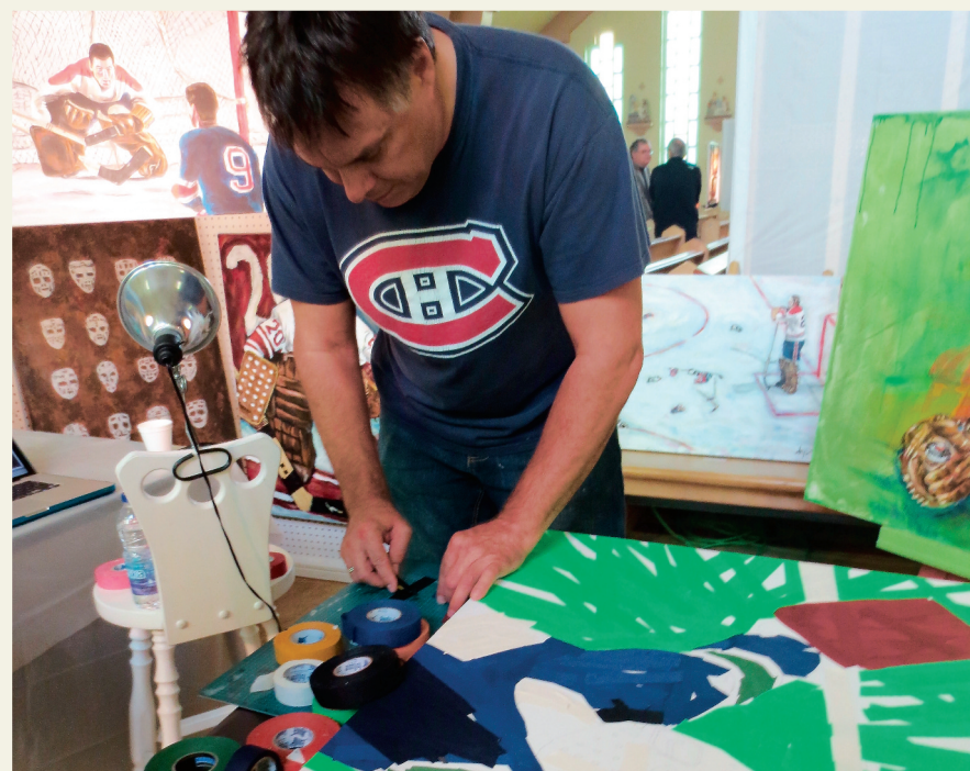
Pour les amateurs de sports, il y avait même des scènes d'hockey illustrées avec du ruban de bâton d'hockey.