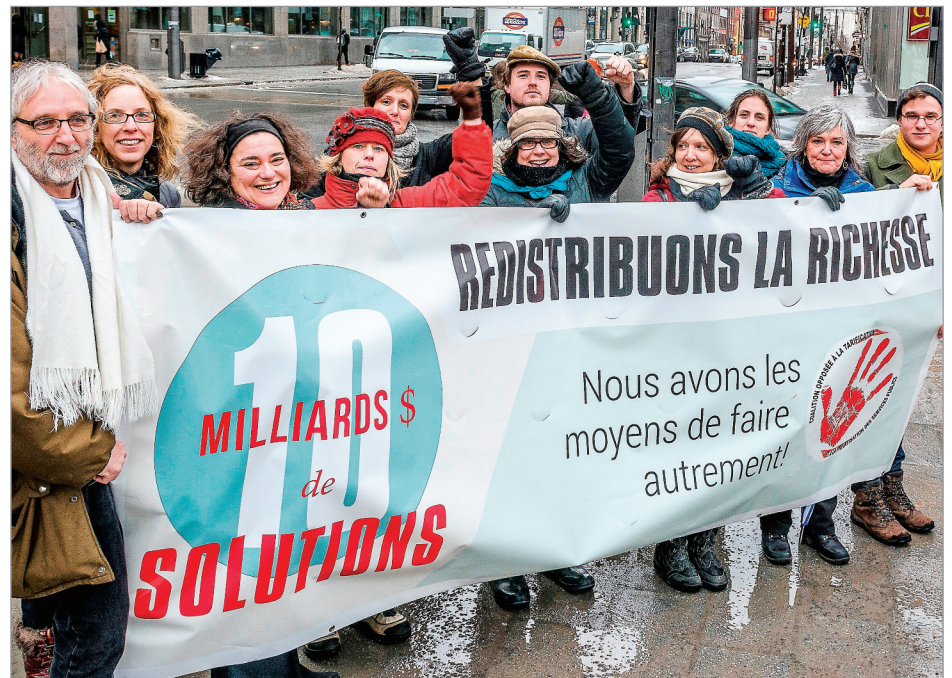
Plusieurs Gaspésiens sont attendus à Montréal pour cette manifestation.

Fondée en 1990, Autocars Orléans Express est le principal transporteur interurbain de passagers par autocar au Québec. L'entreprise dessert les liaisons du corridor Montréal-Québec ainsi que les régions de la Mauricie, du Centre-du-Québec, du Bas-Saint-Laurent et de la Gaspésie. Ses autocars ultramodernes parcourent en moyenne douze millions de kilomètres par an. Orléans Express offre également des services de messagerie par sa division Expedibus ainsi que du transport nolisé. Elle exploite des gares d'autobus, notamment la Gare du Palais et le Terminus Sainte-Foy à Québec. Autocars Orléans Express est détenu par Keolis Canada.