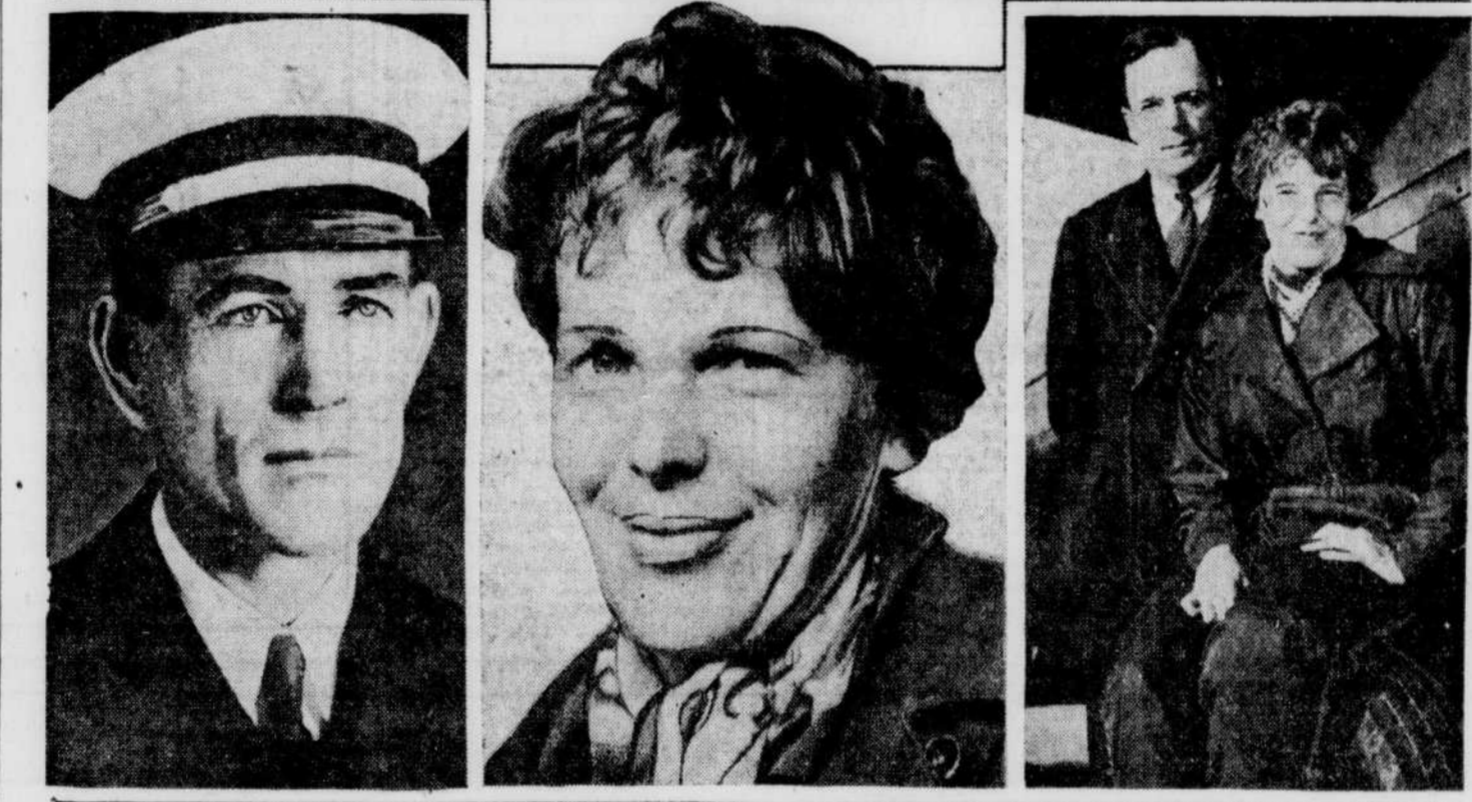
Les plus puissants navires de la flotte américaine du Pacifique sont mobilisés dans l'espoir de retrouver AMELIA EARHART, que l'on croit perdue aux environs de l'île Howland. Elle est accompagnée du capitaine Fred Noonan, que l'on voit ci-dessus, à gauche. Les deux aviateurs se sont envolés à bord d'un avion de $80,000, ultra-moderne. A l'île Howland on a perçu des messages disant qu'il manquait d'essence. Puis, à divers endroits, on a perçu des messages demandant du secours. L'île Howland est à mi-chemin d'Honolulu et de la Nouvelle-Zélande. Les experts en aviation croient que l'embarcation de Miss Earhart pourra flotter pendant plusieurs jours. A droite, on voit la célèbre aviatrice avec son mari, l'éditeur George Palmer Putnam, qui l'accompagne rarement. Sur la vignette du haut, on voit l'avion perdu avec Noonan et Miss Earhart.