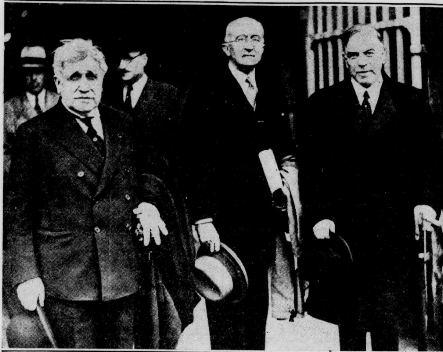
Le Très Honorable W.-L.-MACKENZIE KING, premier ministre du Canada, a présidé, à l'ouverture du pavillon canadien à l'Exposition de Paris, faisant un appel à la bonne entente parmi les nations. On le voit ici en train de visiter la grande exposition accompagnée de l'honorable Philippe Roy, ministre canadien en France, à gauche et à sa droite, M. Greber, architecte à l'exposition de Paris.