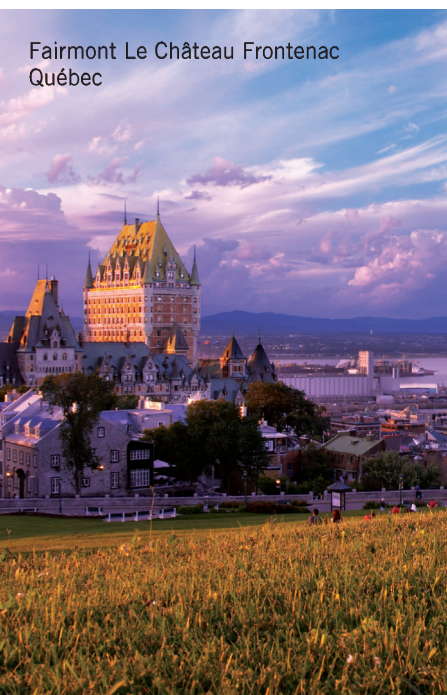
Fairmont Le Château Frontenac Québec