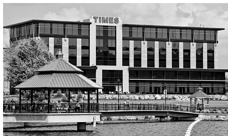
Le Times, un hôtel quatre étoiles situé à Sherbrooke

Toujours dans la dynamique du transport, le tout nouveau bateau de croisière Escapades Memphrémagog, inauguré cet été, permet de se réunir dans une ambiance de luxe et de déguster un repas gastronomique en naviguant sur un lac. Alain Larouche assure que le nouveau venu rem-