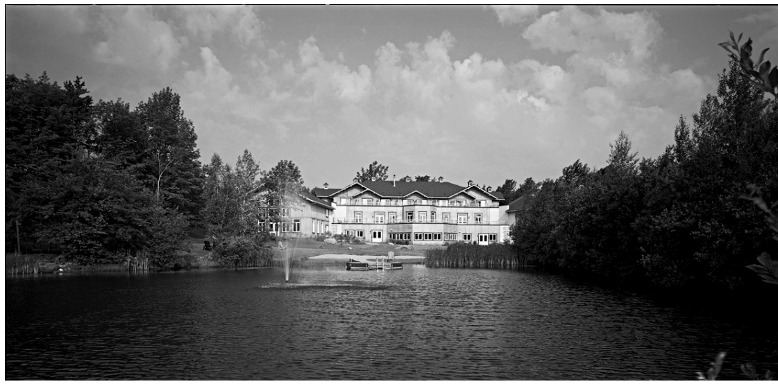
Le Spa d'Eastman a investi trois millions pour ouvrir un pavillon d'affaires séparé du pavillon réservé à sa clientèle individuelle.

un sous-groupe pour réunir des investisseurs constitués d'hôtels et d'organismes d'activités susceptibles d'intéresser les gens qui se déplacent pour des rencontres d'affaires. «Ce sont des entreprises qui sont prêtes à investir ensemble, d'une façon un peu plus pointue et plus élevée pour explorer ensemble des mécanismes et des marchés pour aller chercher des congrès», explique Alain Larouche, joint par téléphone à son bureau de Sherbrooke. Au bout du compte, de nombreux hôtels qui, en temps normal, se livreraient une concurrence féroce pour gagner le marché s'unissent pour faire venir la clientèle dans la région. «S'ils acceptent de le faire, c'est parce qu'on court ensemble la chance de développer une clientèle individuelle supplémentaire qui va revenir chez nous, explique-t-il. Ce qu'on souhaite, dans le fond, c'est que le corporatif nous amène