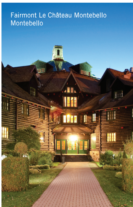
Fairmont Le Château Montebello Montebello

Théâtre de rue dans la rue des Forges, à Trois-Rivières