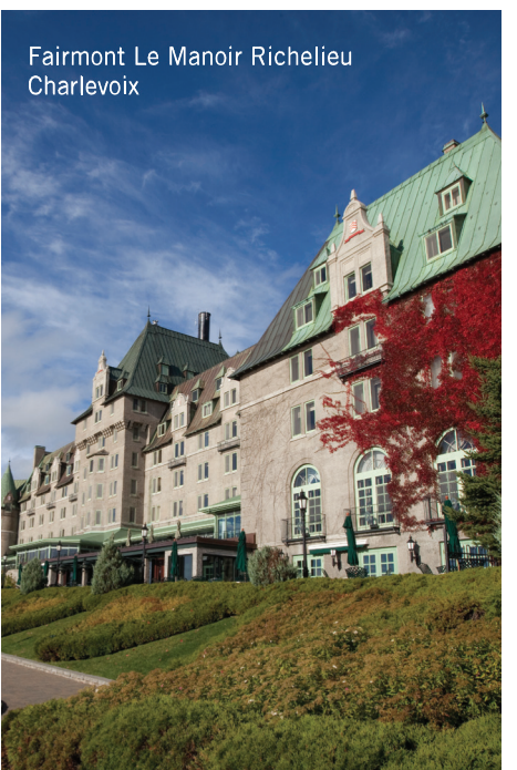
Fairmont Le Manoir Richelieu Charlevoix