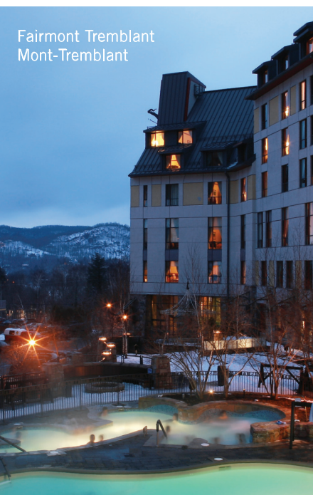
Fairmont Tremblant Mont-Tremblant