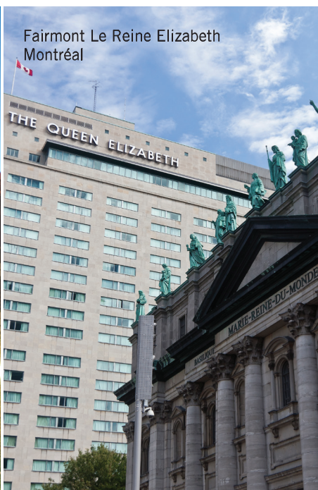
Fairmont Le Reine Elizabeth Montréal