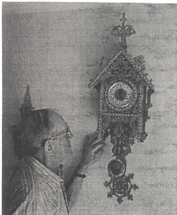
Une horloge suisse!

J'adore faire ce travail, c'est mon hobby de retraite depuis trois ans. C'est un passe-temps agréable.