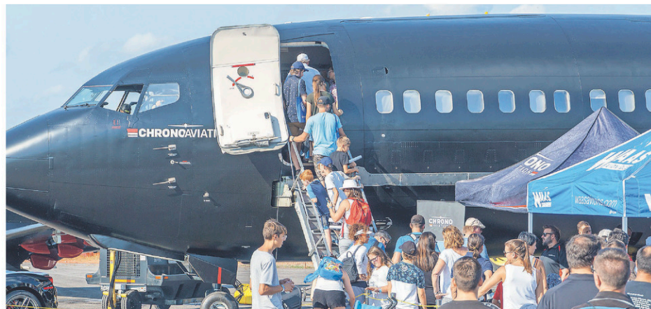
La visite des aéronefs gagne en popularité année après année au rassemblement aéronautique de Bromont.

L'organisme Aviation Connection, qui propose des cours gratuits sous forme d'activités