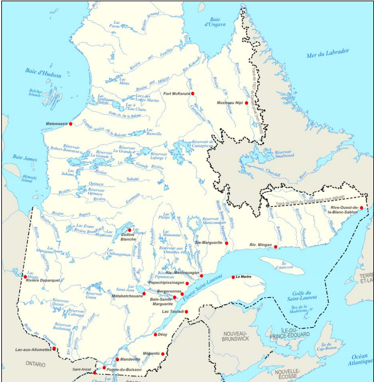
Figure 1 Localisation des sites archéologiques mentionnés dans cette étude (Fond de carte : MRNF).