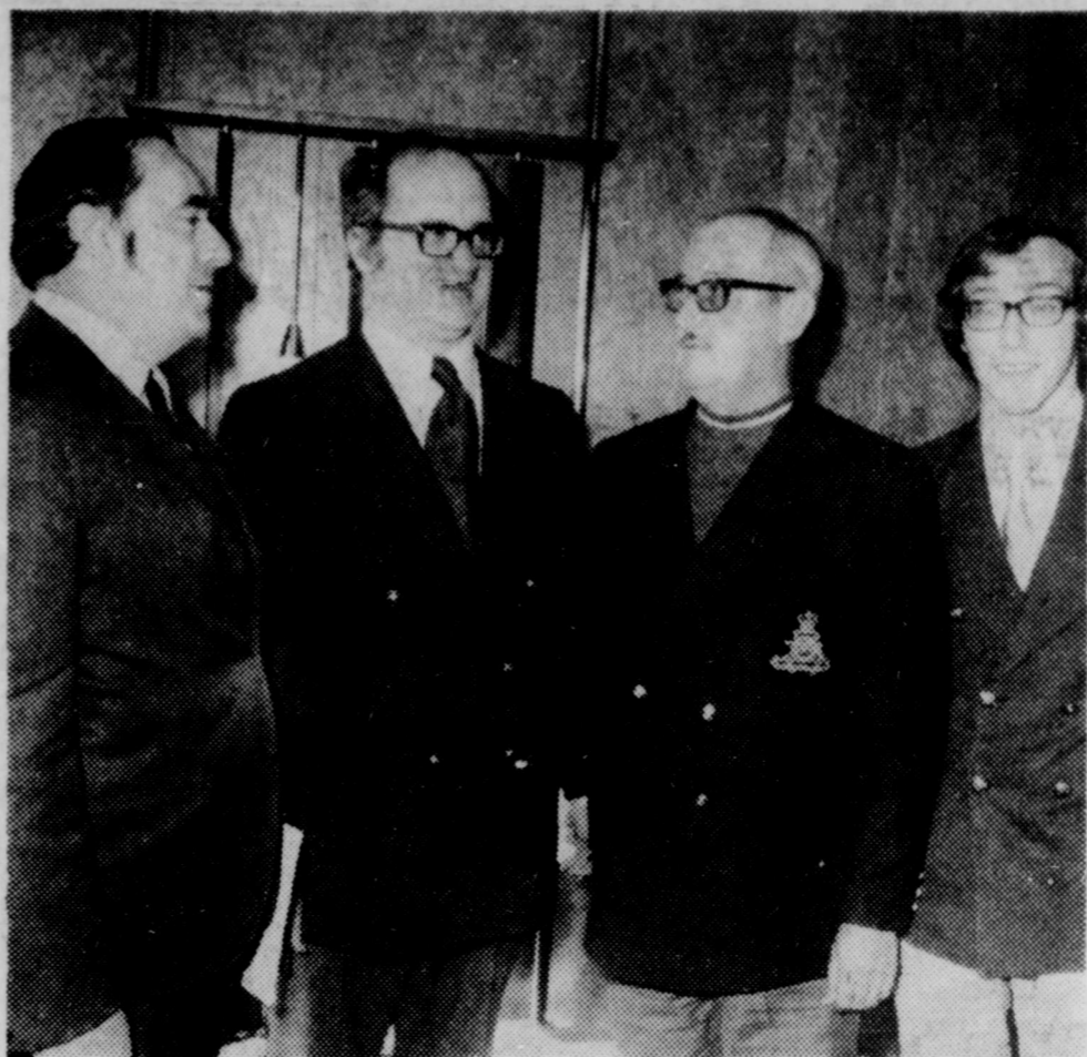
Ce n'est pas à un mois à quatre exposés que les membres de la Chambre de commerce de Victoriaville ont eu à faire face dimanche matin. Le président de la

En terminant le PQ-Arthabaska dit accorder son appui inconditionnel à tous les individus ou organismes qui voudraient agir démocratiquement dans le même sens que lui.