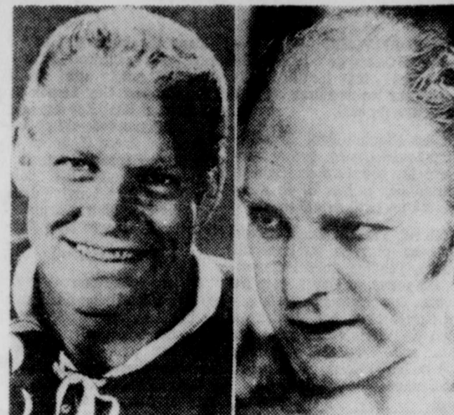
Bobby Hull, la comète blonde des Black Hawks de Chicago.

LOS ANGELES (PC)—Les Canadiens de Montréal ont cédé Phil Roberto aux Blues de St-Louis hier soir en retour de Jim Roberts, qui avait été repêché par St-Louis en 1967. Avant cette saison, Roberts a récolté 65 buts et 93 aides en 512 matches, plus cinq buts et sept aides cette saison. Roberto a réussi trois buts et deux aides en 27 matches avec les Canadiens cette année. Avec la saison, il avait récolté 14 buts et huit aides en 47 matches dans la LNH.