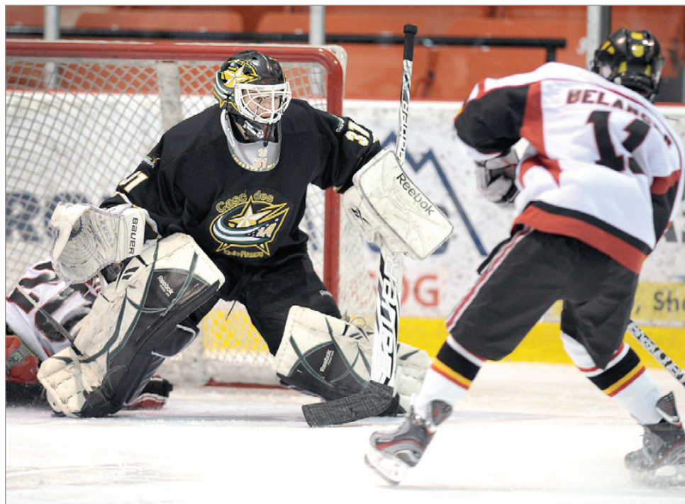
Les amateurs de hockey de la région pourront voir du très bon calibre de jeu au début du mois de septembre à Chandler et Carleton-sur-Mer.

(A.L.) Les Albatros du Collège Notre-Dame entameront leur calendrier régulier 2013-2014 en Gaspésie dans le cadre des activités de « Célébrons notre hockey III ».