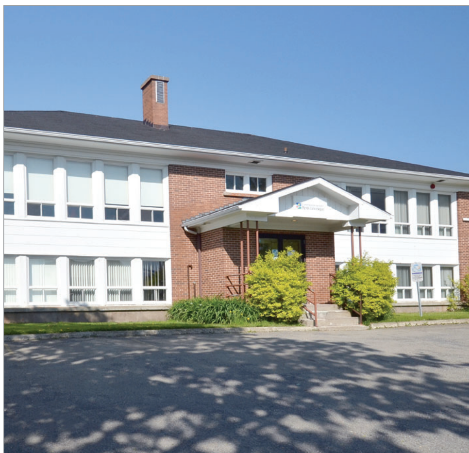
L'école St-Michel de Percé : une étape de plus de franchise.

bonne forme, a reçu des rénovations. La Commission scolaire ne s'en départira pas pour rien. C'est un bien qui appartient au public, après tout », a commenté Mme Bourdages. À titre d'exemple, des bâtiments ayant été mis en vente par le passé, dans des circonstances similaires, ont été vendus à des prix allant de 5000 à 106 000 $. Une fois l'offre acceptée par la CSRL, elle devra être entérinée par le ou la ministre de l'Éducation.