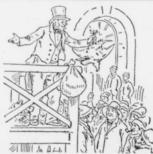
LA VENTE À L'ENCAN OU LA CRIÉE

On assistait encore, de temps à autre, à la vente à l'encan ou vente aux enchères menée rondement par un encanteur ou sorte de crieur public plus habile que les gens ordinaires à cette sorte de travail. Il s'agissait alors de disposer en tout ou en partie des meubles, outils et autres biens d'un établissement quand des circonstances spéciales voulaient ou simplement favoriseraient l'emploi d'une telle mesure. Au fait, la chose ne présentait en général aucun caractère tragique mais au contraire tournait souvent en véritable fête populaire où les dépossédés s'amusaient aussi fermement que