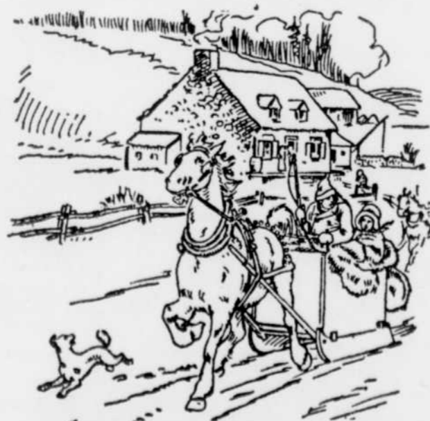
LE RETOUR DE L'EGLISE

Il y avait aussi l'institution traditionnelle du bi — ou corvée générale — en vertu de quoi toute la population des environs accourait sur un simple signal des intéressés afin