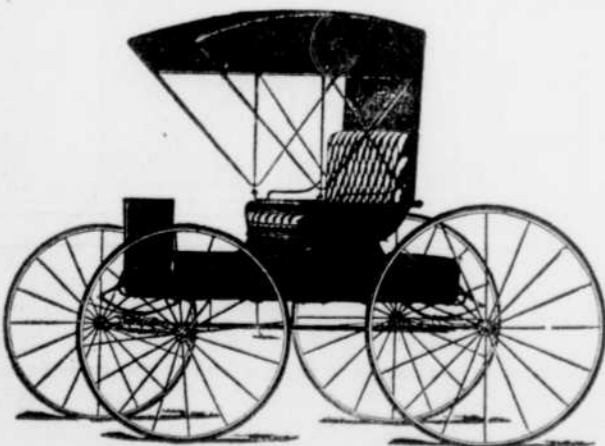
CETTE VOITURE OU «BUGGY» COÛTAIT À L'EPOQUE $54,90!

Quant aux charges légères qui exigeaient un déplacement plus rapide, toutes les familles bien organisées possédaient au moins un cheval de course qui faisait toujours la joie des plus jeunes et l'orgueil évident des propriétaires de la place. On pouvait alors facilement se rendre compte de la chose lorsqu'il fallait aller au village pour des démarches urgentes, ou pour l'assistance aux offices du rituel à certains jours obligatoires, ou même encore quand on songeait à s'attirer les oeillades favorables et les commentaires élogieux des jeunes filles.