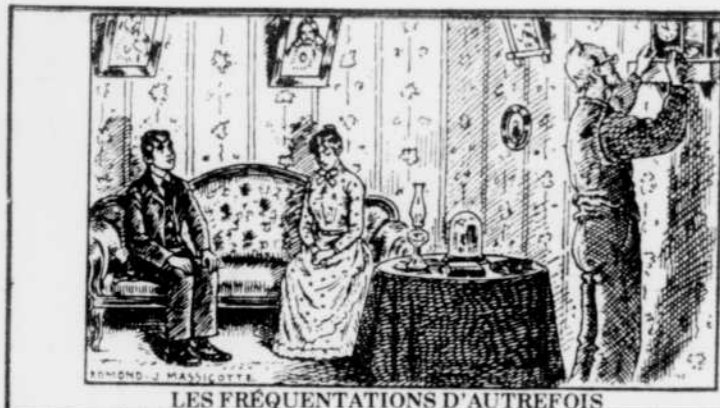
LES FRÉQUENTATIONS D'AUTREFOIS