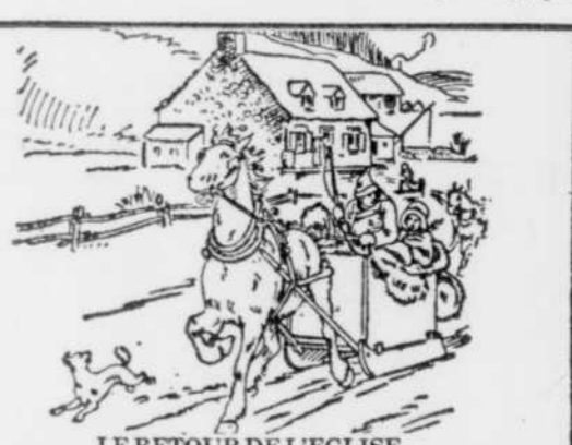
LE RETOUR DE L'EGLISE